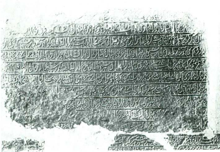
Res. 2 — Abbildung 2.