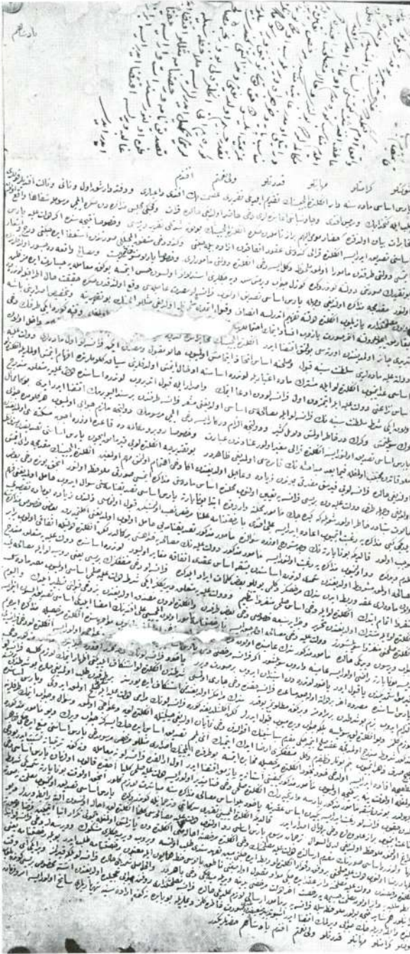
Res. 7 — Âmedi Galib Efendi'nin murahhaslıkla Fransa'ya gönderilmesi hakkında telhis ve hatt-ı hümayun.