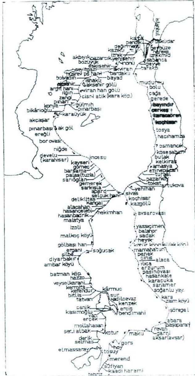
Harita 1: 14. Murad'ın Revan Seferi Menzilleri (1635) (Aydın, 1984)