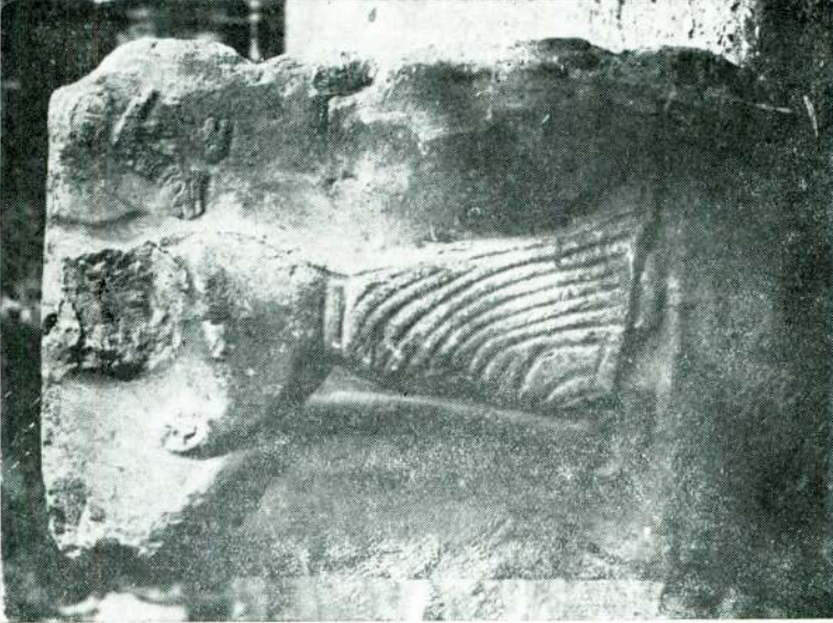
Res. 1-2 — Yazılıkayada bulunan Eti kabartması.