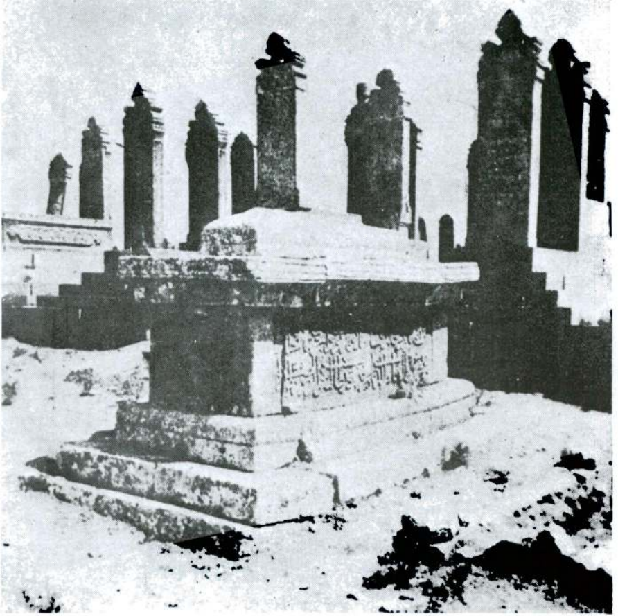
Res. 3 — Makam-ı İbrahim mezarlığı.