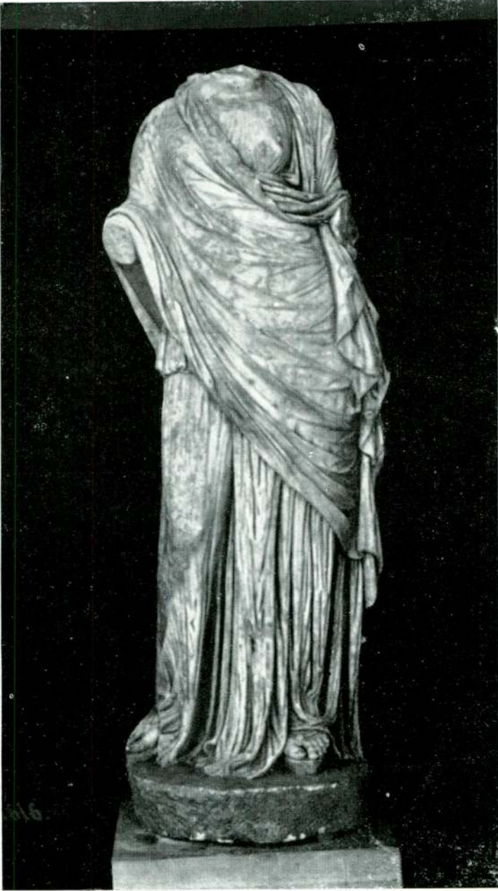
Resim 13 — Milet. (İstanbul).