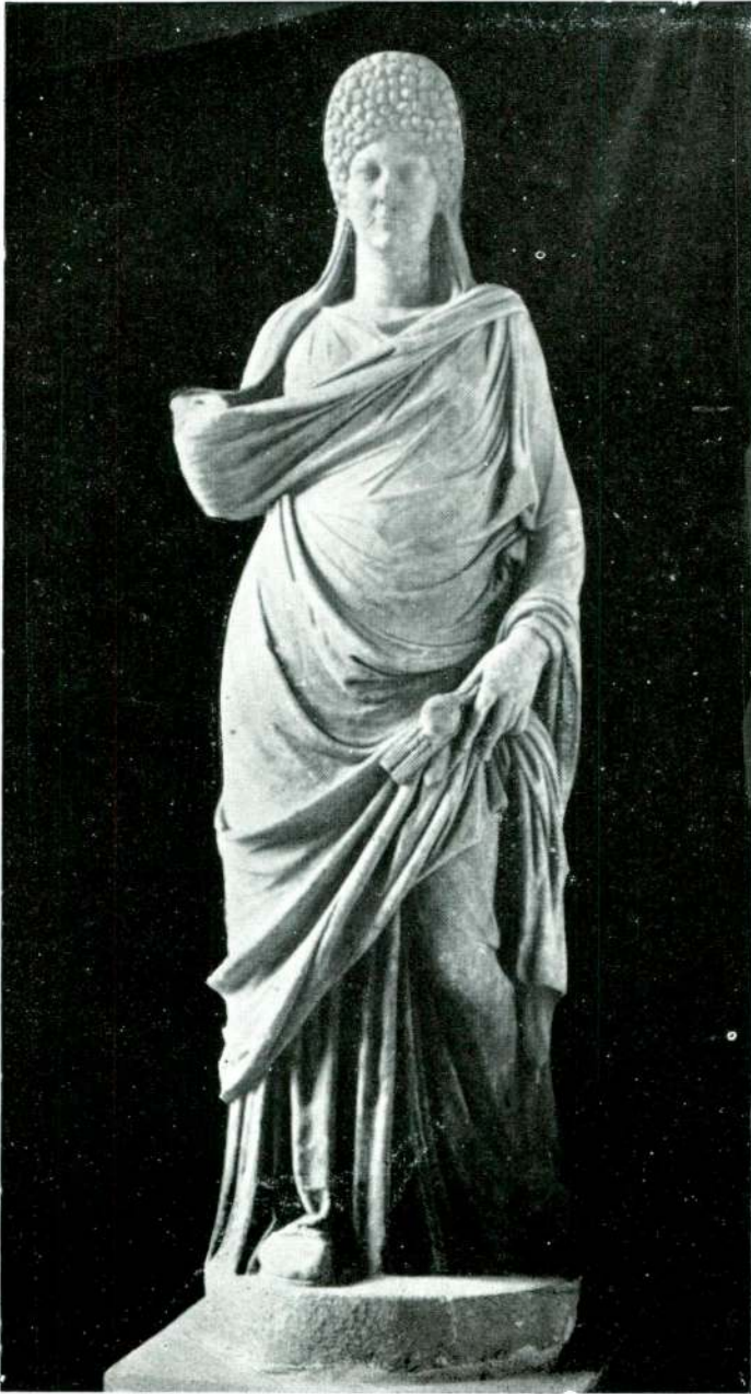
Resim 5 — Afrodizias. (İstanbul).