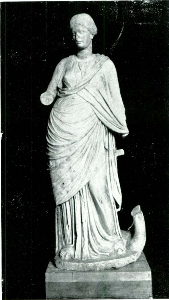
Resim 11 — Milet. (İstanbul).