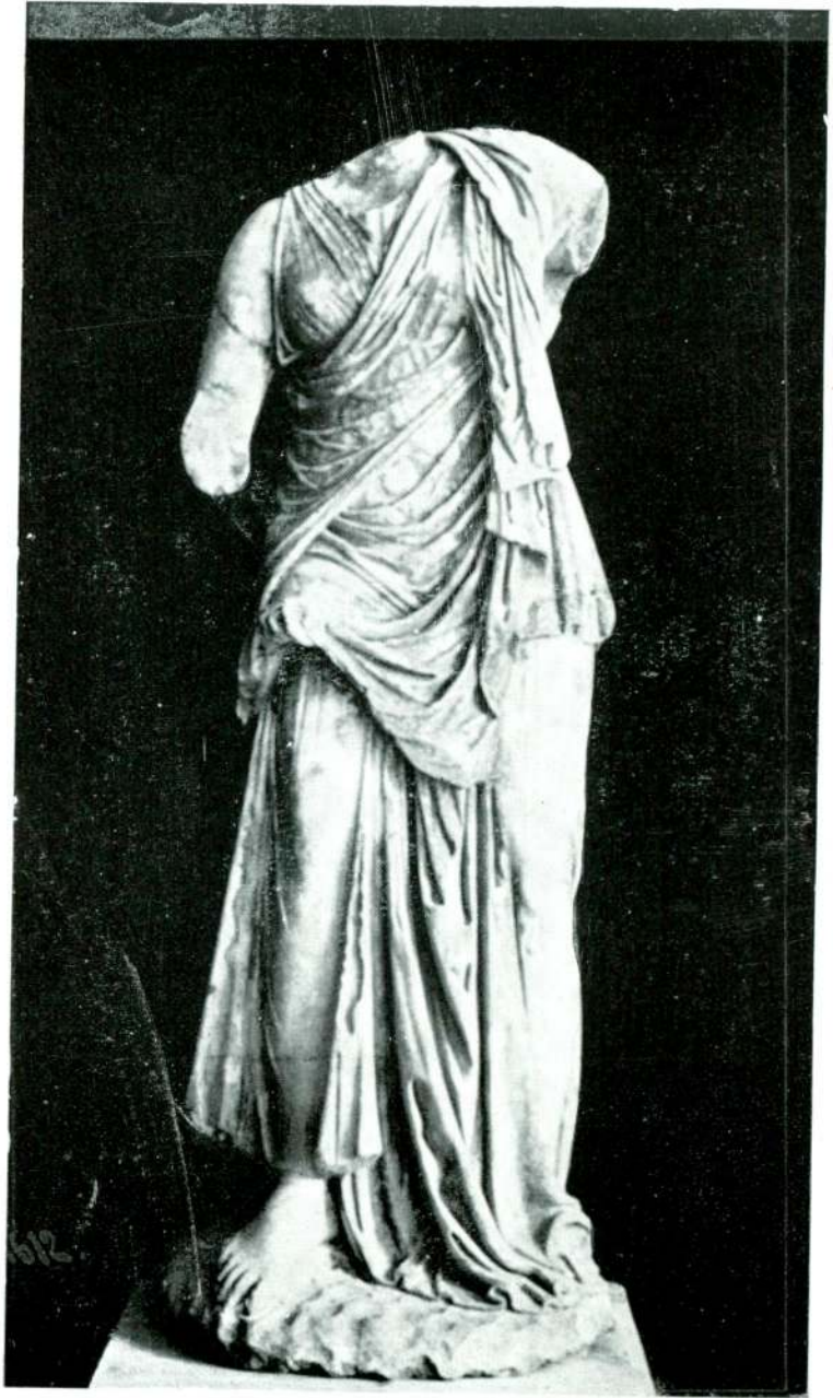
Resim 14 — Milet. (İstanbul).