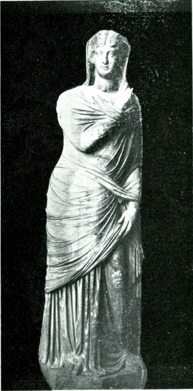
Resim 19 — Yalvaç. (İstanbul).