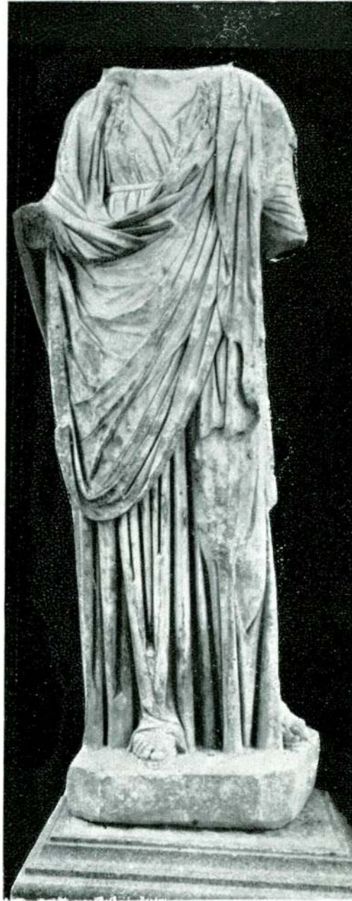
Resim 18 — Efes. (İzmir).