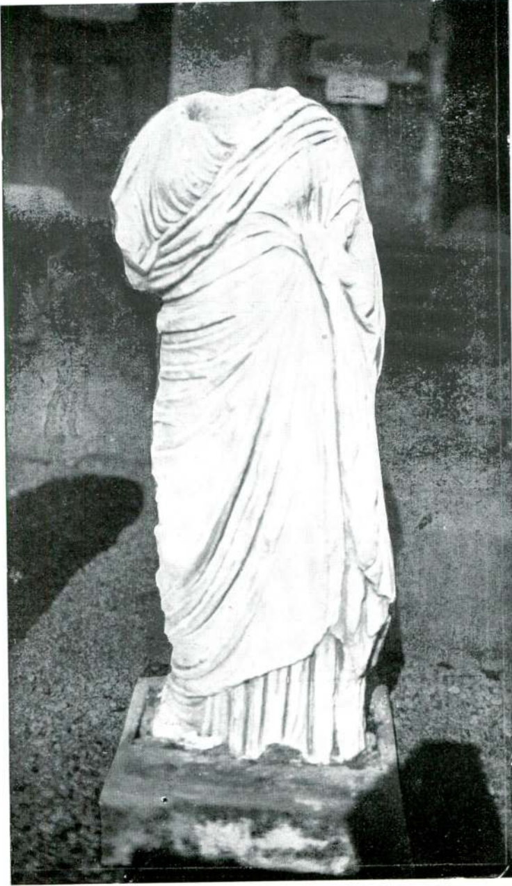
Resim 3 — Meandr Manisasi. (Izmir).