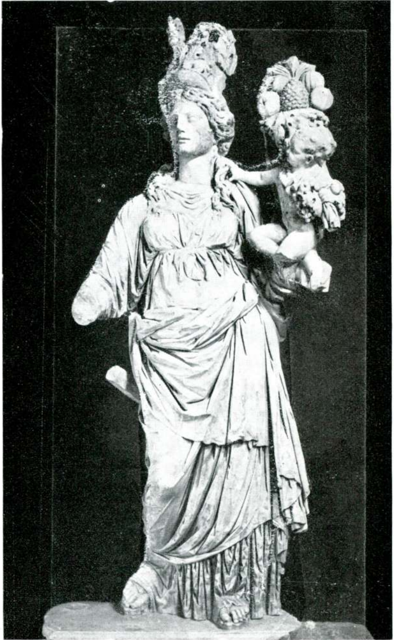
Resim 20 — Bolu. (İstanbul).