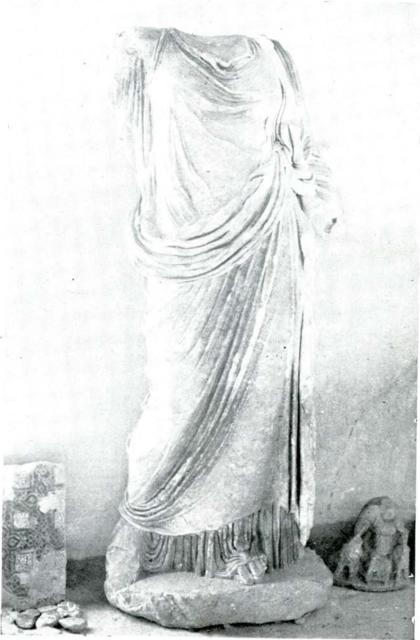
Resim 10 — Aspendos. (Antalya).