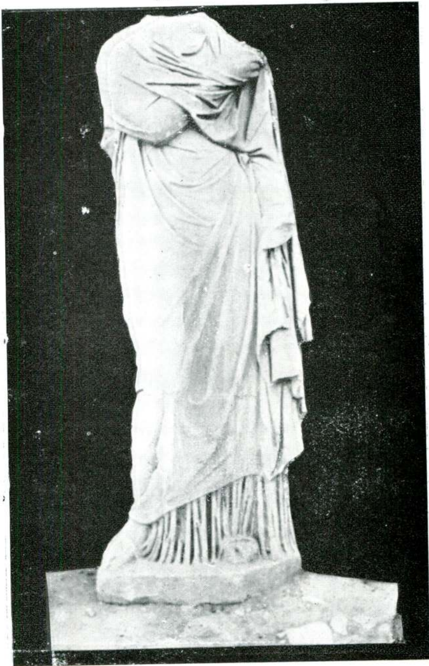
Resim 21 — Silifke. (Silifke).