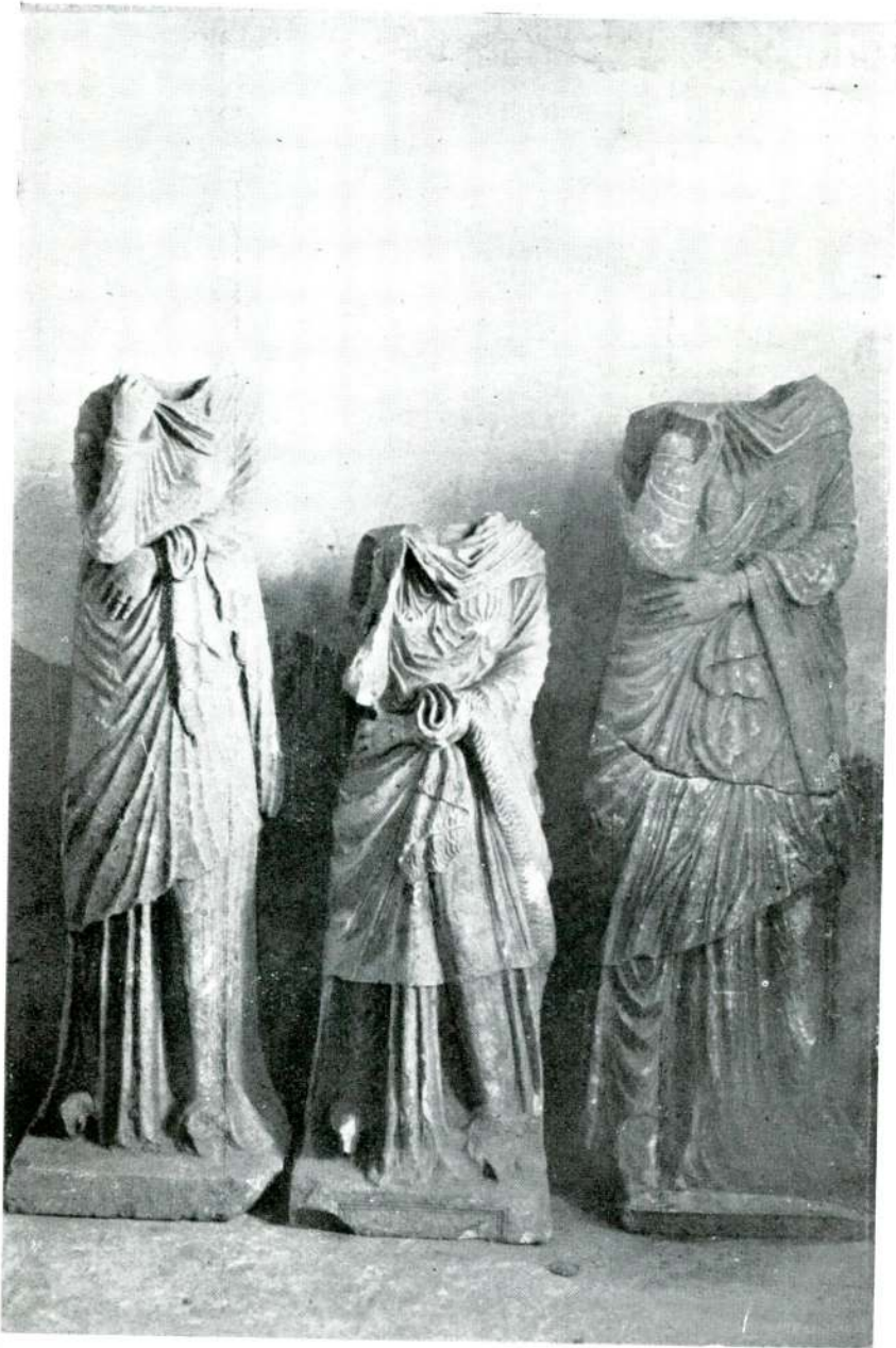
Resim 21 a -- Silifke. (Silifke).