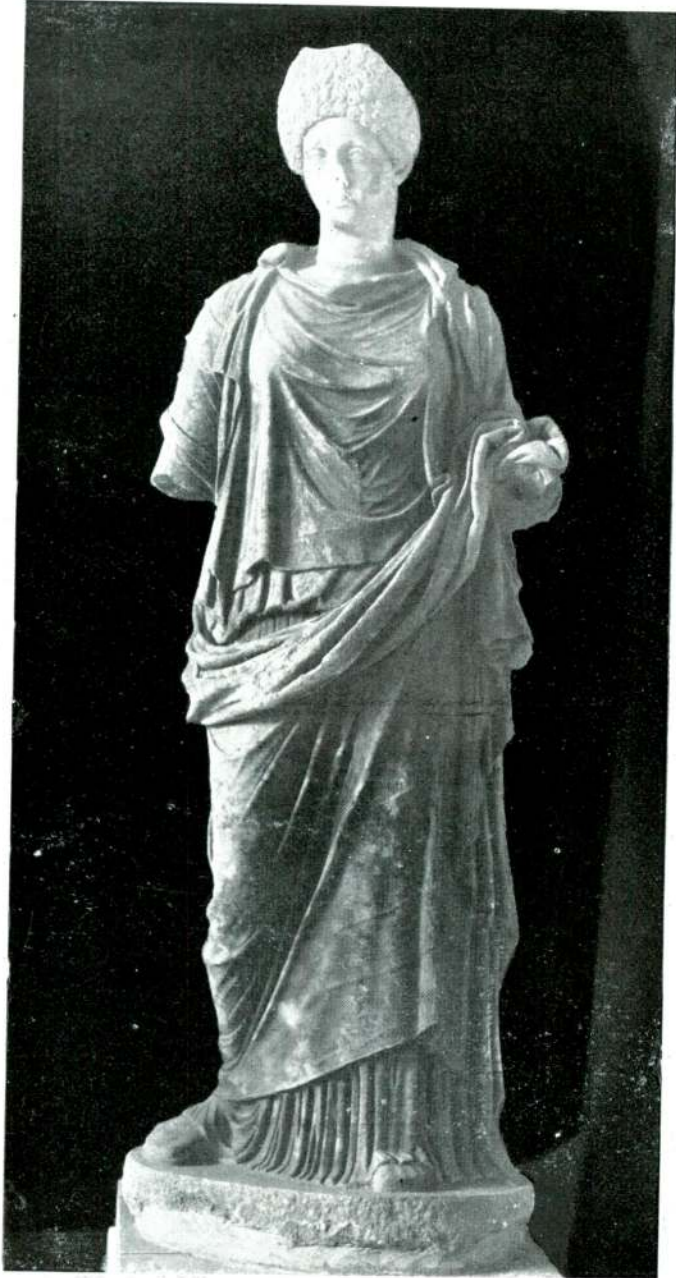
Resim 6 — Afrodizias. (İstanbul).