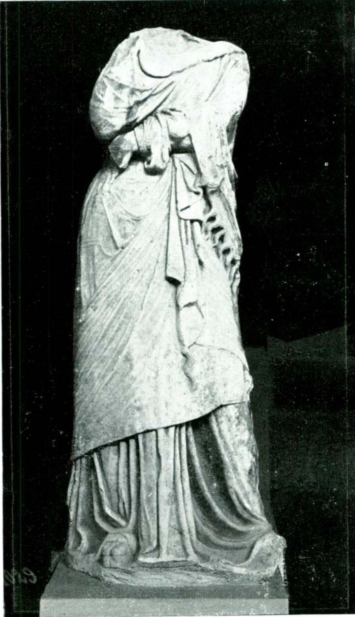
Resim 7 — Afrodizias. (İstanbul).