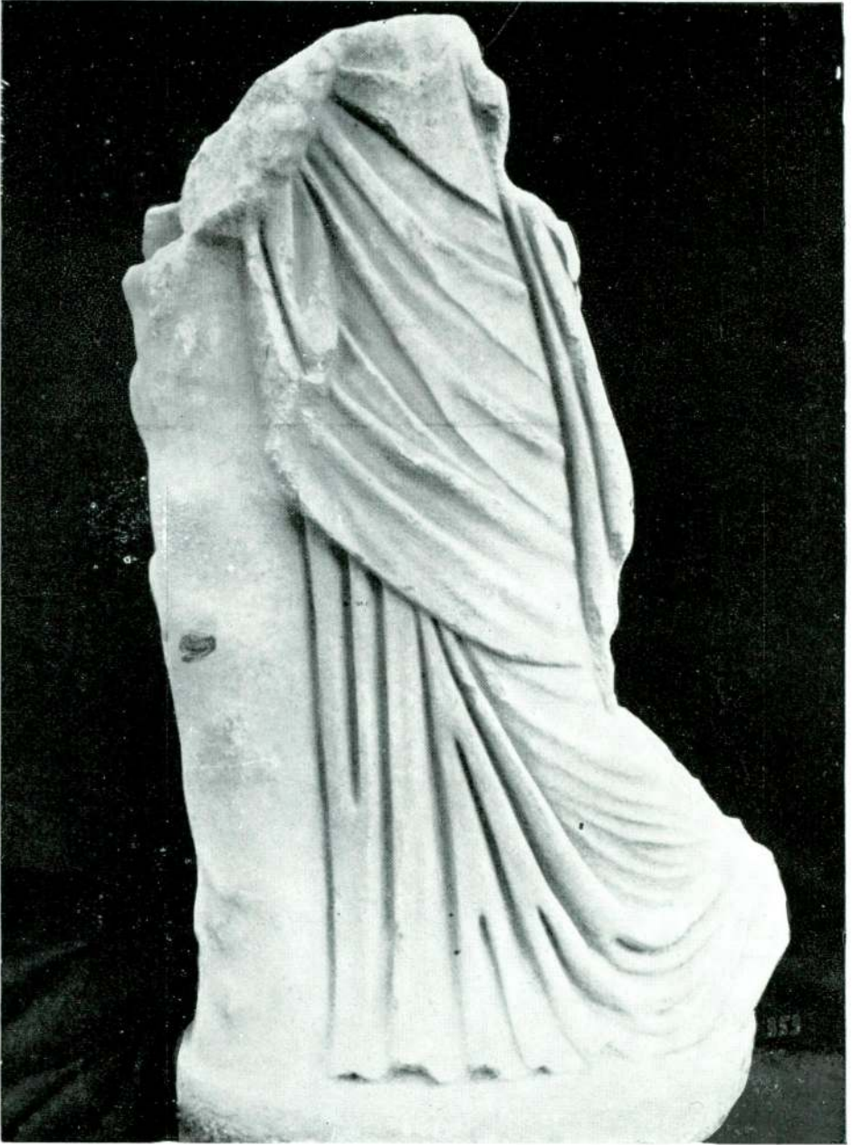
Resim 16 — Efes. (İzmir).