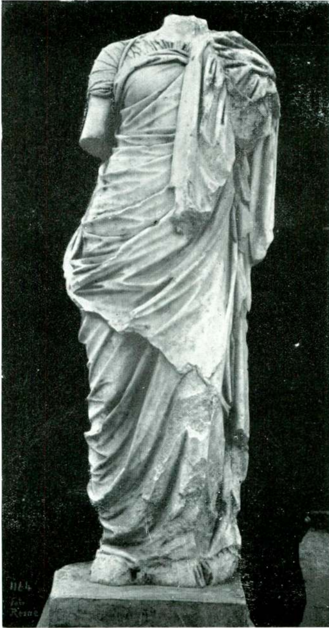
Resim 15 — Efes. (İzmir).