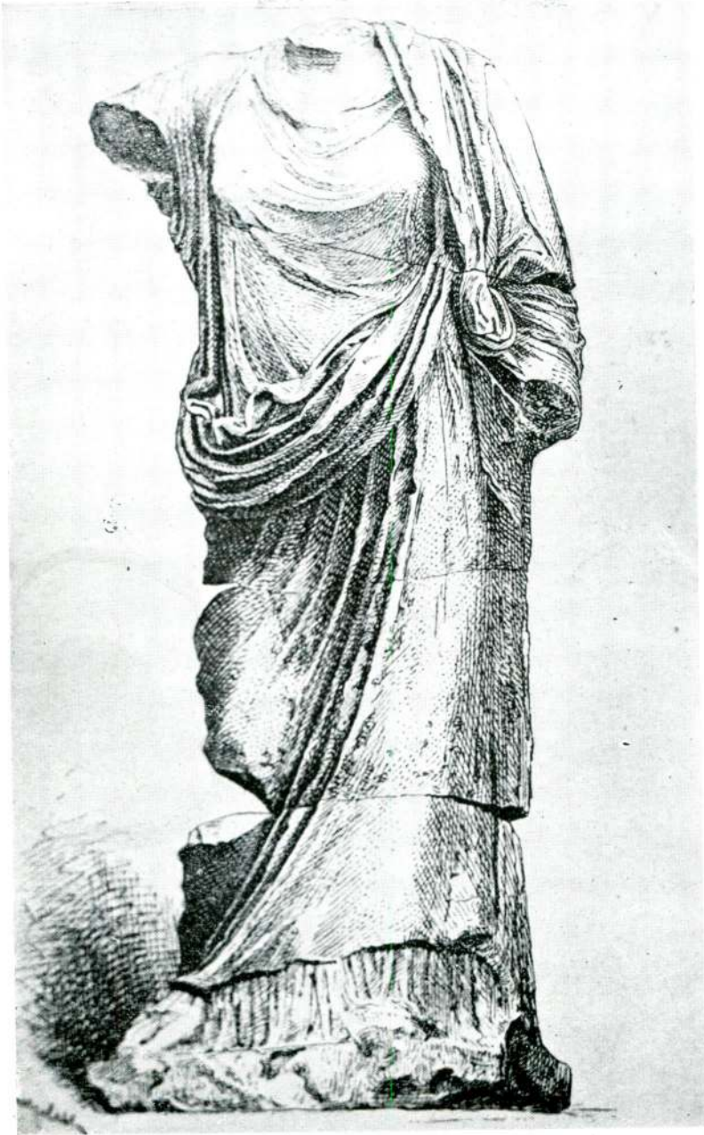
Resim 9 — Aspendos. (Aspendos).