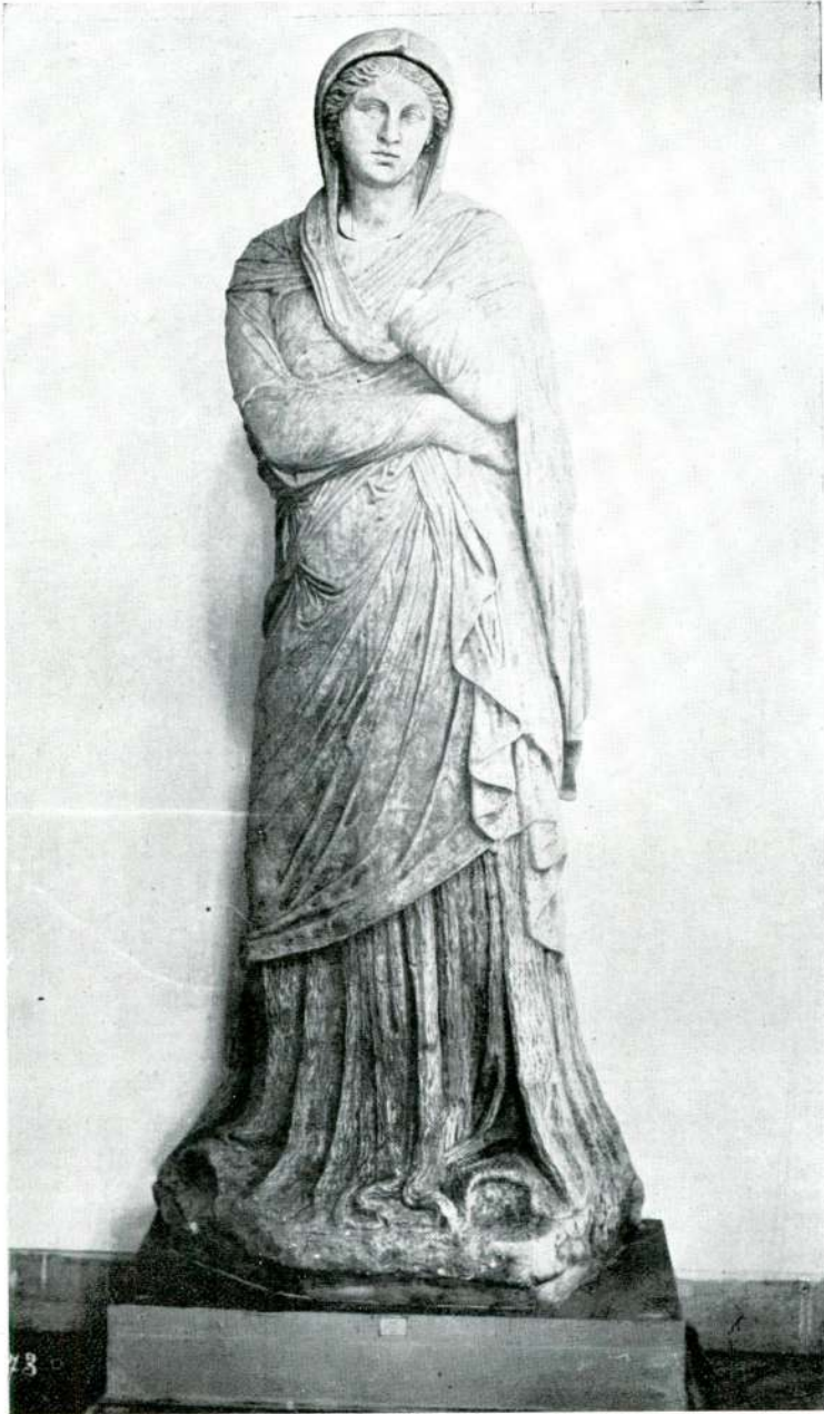
Resim 1 — Meandr Manisası. (İstanbul).