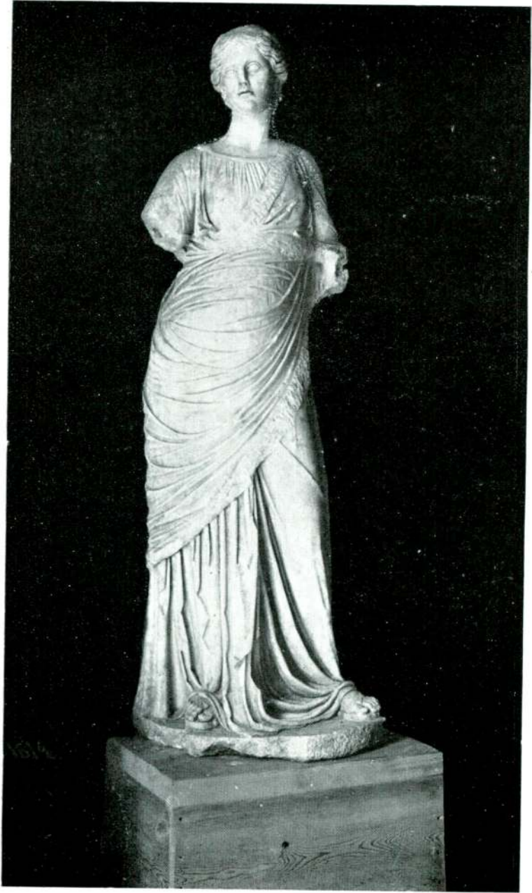
Resim 12 — Milet. (İstanbul).