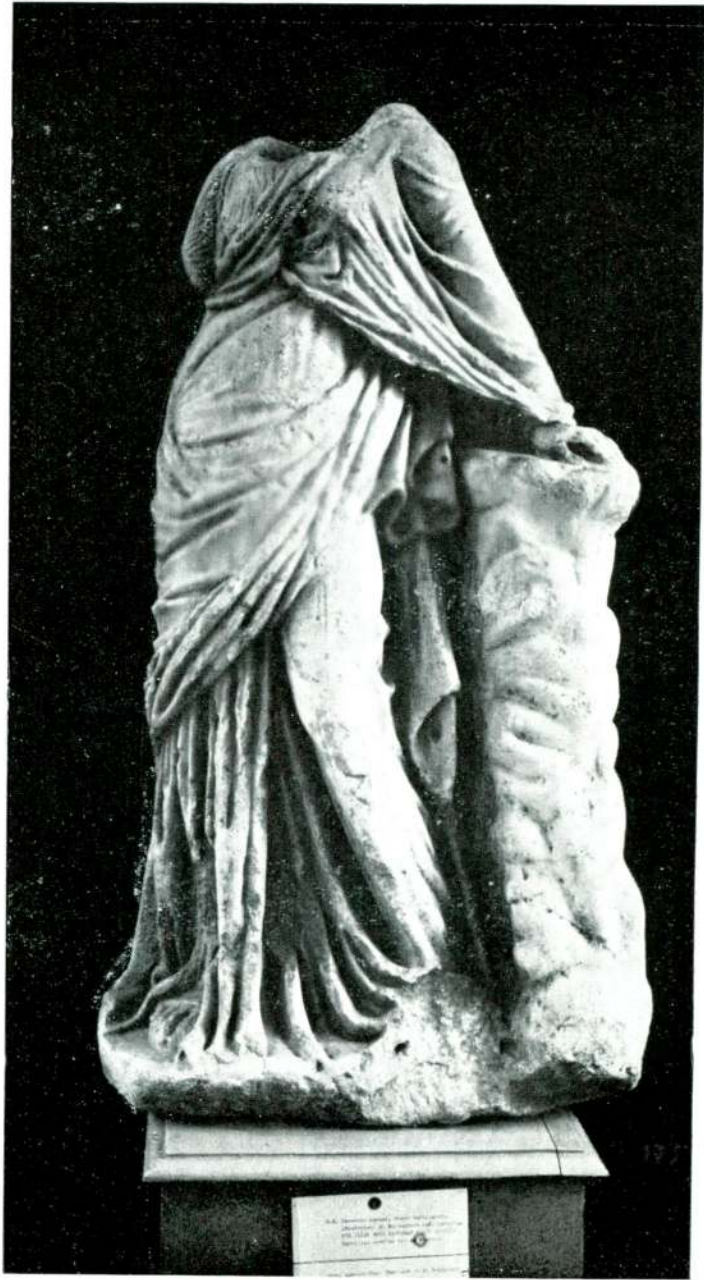
Resim 8 — Afrodizias. (Izmir).