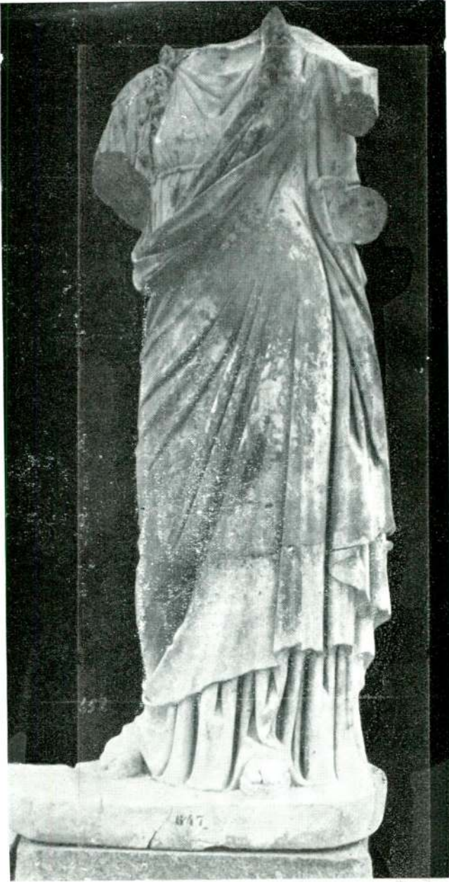
Resim 17 — Efes. (İzmir).