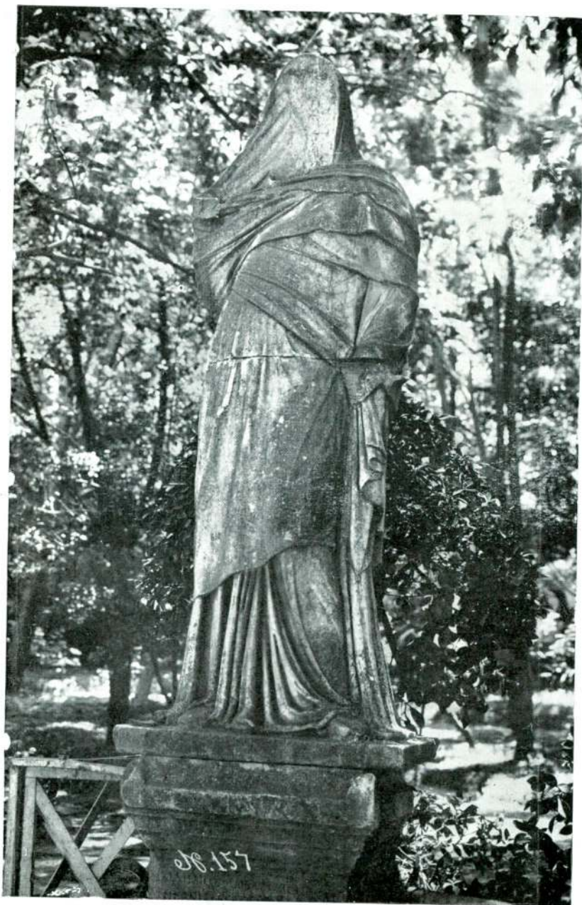
Resim 2 — Meandr Manisasi. (Istanbul).