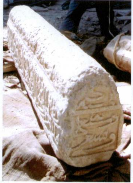
Resim 5- Mehmed Bey'in Mezar Taşının 7. ve 8. yüzü