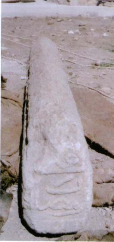
Resim 4- Mehmed Bey'in Mezar Taşının 5. ve 6. yüzü