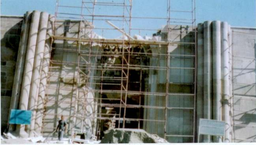
Resim 1- Restorasyon halindeki Kayseri Sultan Hanı Portalı