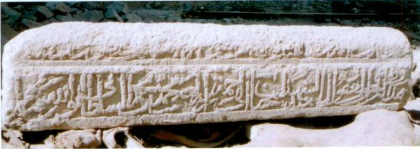
Resim 3- Mehmed Bey'in Mezar Taşının 2. ve 4. Yüzü