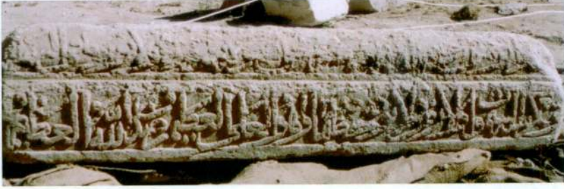
Resim 2- Mehmed Bey'in Mezar Taşının 1. ve 3. yüzü