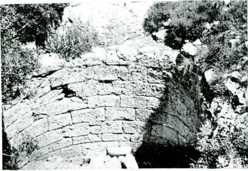
Resim 9 — Akçakaya'da sarniç.