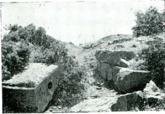
Resim 6 — İzmir Kalesi, Yapı temelleri.