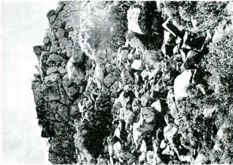
Resim 11 — İzmir kalesi duvarları.