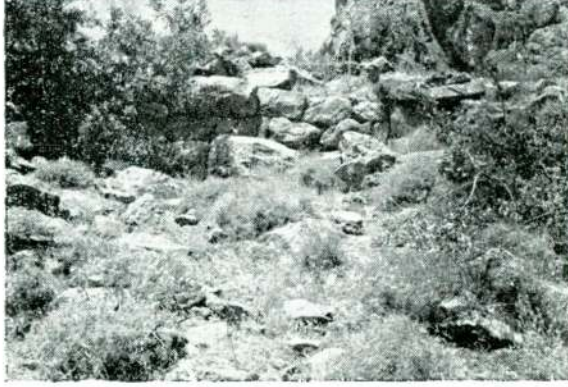
Resim 7 — Adatepe, «Temenos» duvarı.