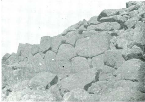
Resim 4 — Tantalos mezarı, Polygonal örgülü dış duvar.