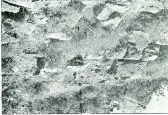
Resim 8 — Adatepe, «Temenos» duvarı.