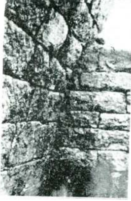
Resim 3 a — Tantalos mezarı, Mezar odası.