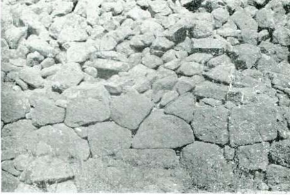
Resim 2 — Tantalos mezarı, Polygonal örgülü dış duvar.