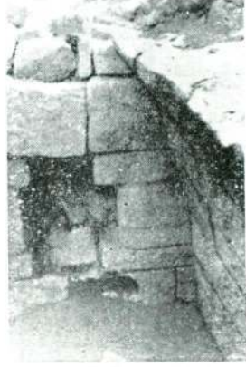
Resim 3 b — Tantalos mezarı, Mezar odası.