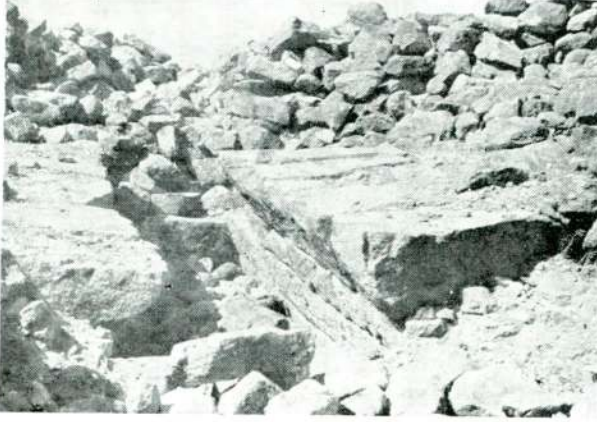
Resim 1 — Tantalos mezarı, üstten görünüş.