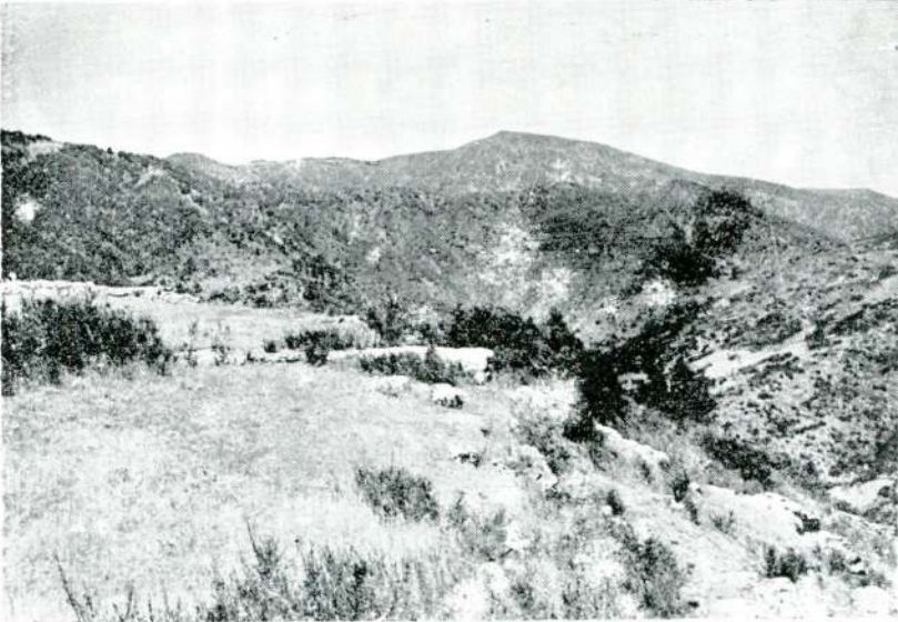
Resim 10 — Akçakaya, genel görünüş.