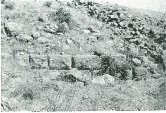
Resim 5 — İzmir, Küçük tümülüs.