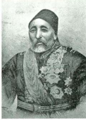
Kayserili Ahmed Paşa'nın ilk Harbiye Nazırlığındaki resmi