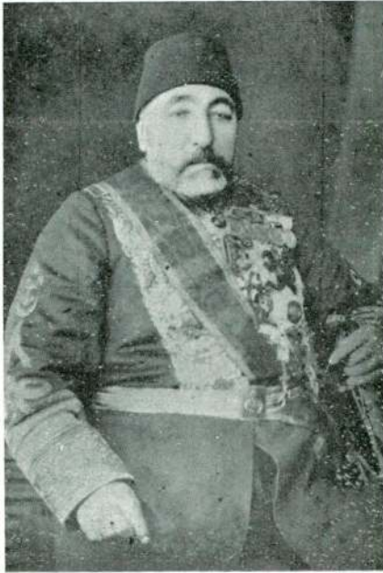
Kayserili Ahmed Paşa'nın son resimlerinden