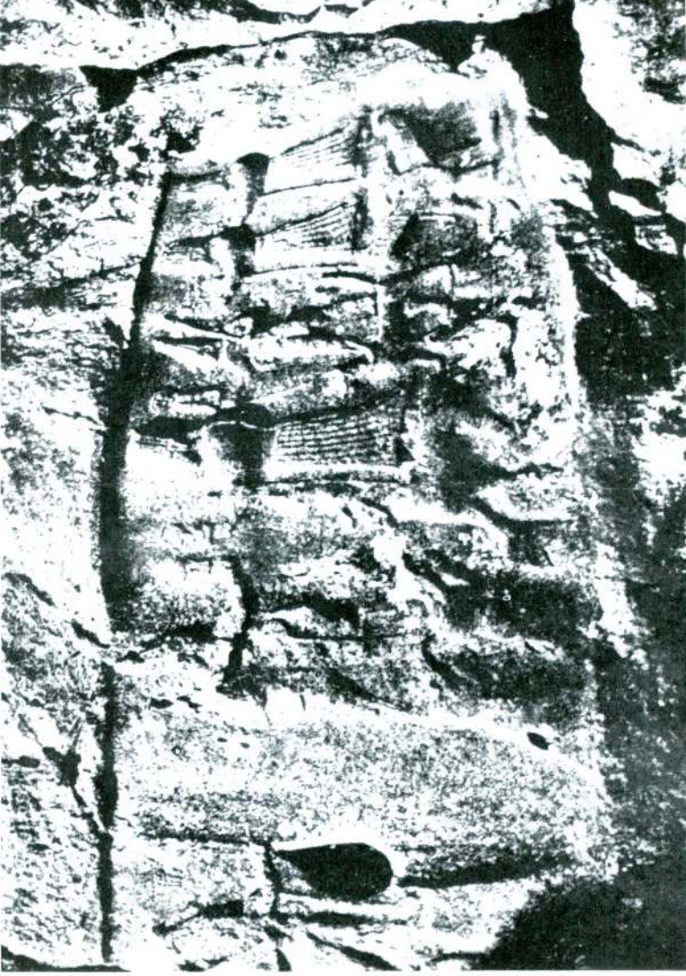
Yazılıkayadan bir parça