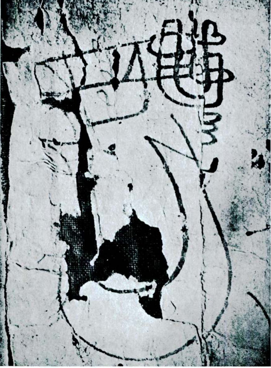
Temliknâmenin baş tarafındaki tuğra (Mehmed bin Bayezit Han Muzaffer) Belleten : C. III S. 11 / 12