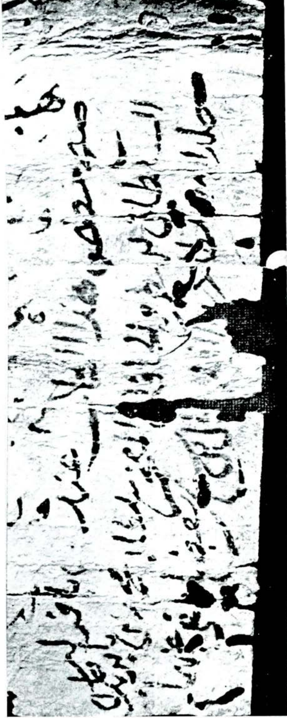
Hükümdarın ikrarı üzerine mülknameyi tasdik eden Kadı Bali bin Şeyh Mustafa'nın bükümü