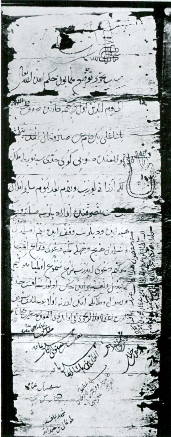
Çelebi Mehmed'in Paşa Ali Beye verdiği temlikname