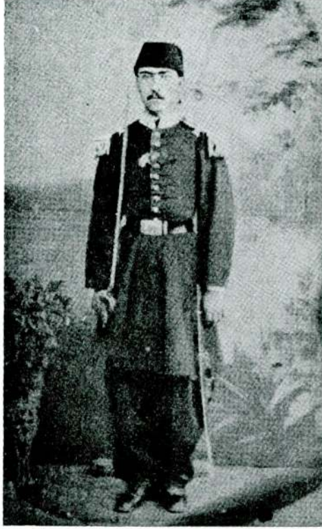
Atatürk'ün Babasının gönüllü zabıt kıyafeti