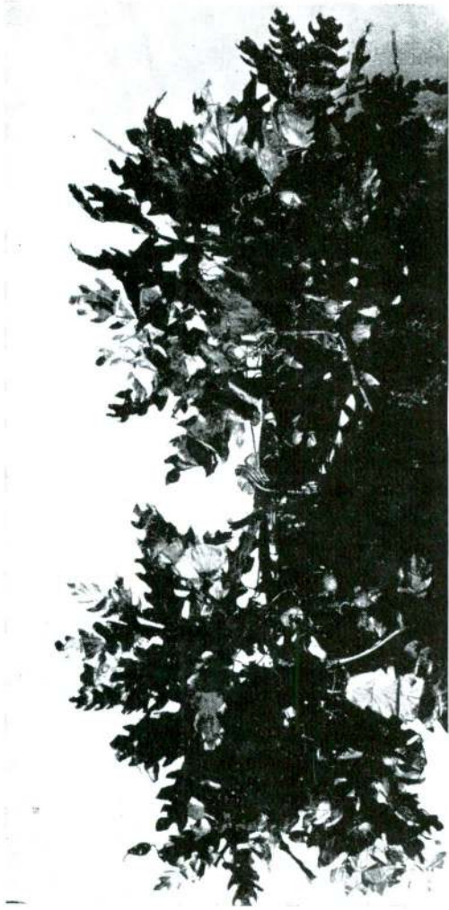
Bergama'da bulunmuş altın taç