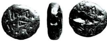
Döğme mühür (tabii büyüklükte) Knopfsiegel (natürliche grösse)