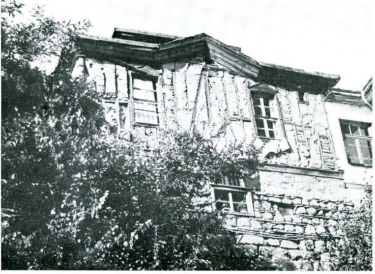
Res. 3 — Dış Hisar Yayçeken Sok. No.: 12. (Atpazarı Meydanından görünüş)