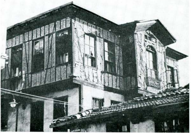
Res. 4 — Dış Hisar Kale Kapısı Sok. No.: 18