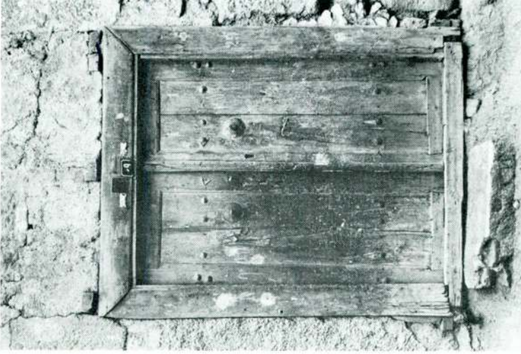
Res. 6 — İç Hisar Ali Taşt Sok. No.: 9.