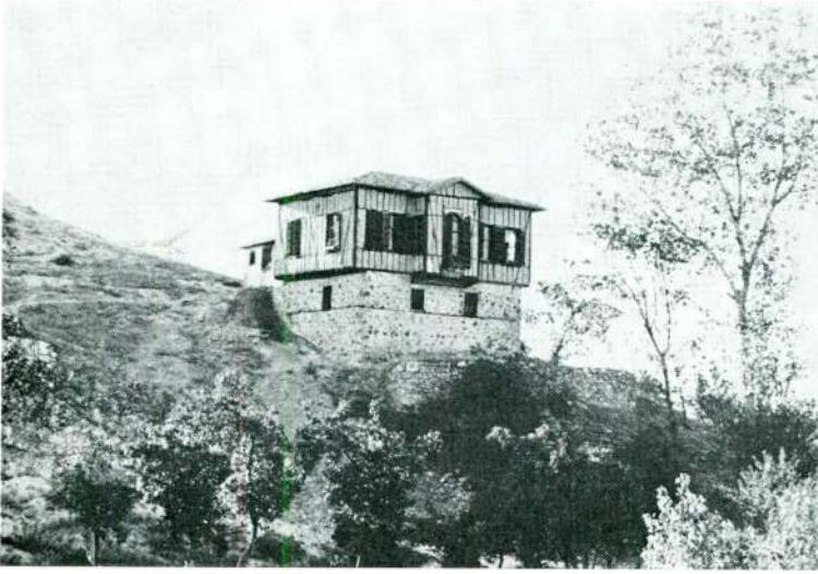
Res. 1 — Kâmil Ocak Mahallesi Mecidiye Bağları No.: 78