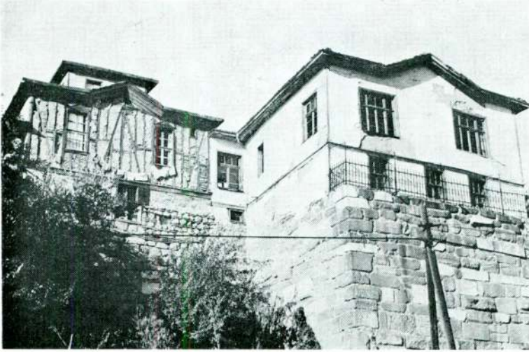
Res. 2 — Dış Hisar Yayçeken Sok. No.: 12-14 (Atpazarı Meydanından görüntü)