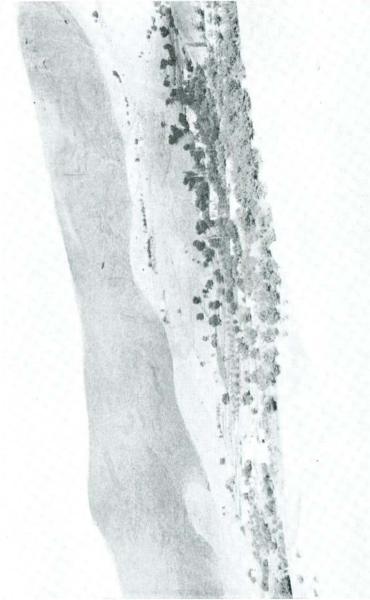
Res. 1 — Samah (Malatya)