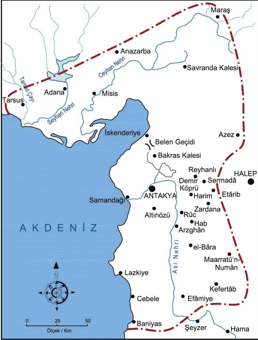
Harita 2. Afrin Savaşından önce Antakya Haçlı Prinkepliğinin sınırları.