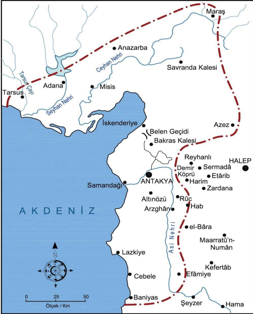
Harita 3. Afrin Savaşından sonra Antakya Haçlı Prinkepliğinin sınırları (1, 2 ve 3 numaralı haritalar T. Asbridge tarafından yayınlanan haritalara dayanarak hazırlanmıştır. T. Asbridge, “The Significance and Causes of the Battle of the Field of Blood”, Journal of Medieval History , (23:4/1997), s. 304, 310.