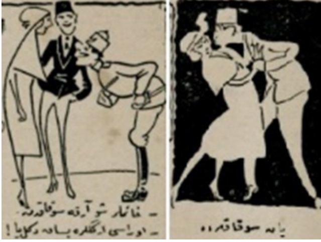
Şekil 5: Direklerarası'nın Arka Sokakları ( Aydede , 10 Mayıs 1922.)