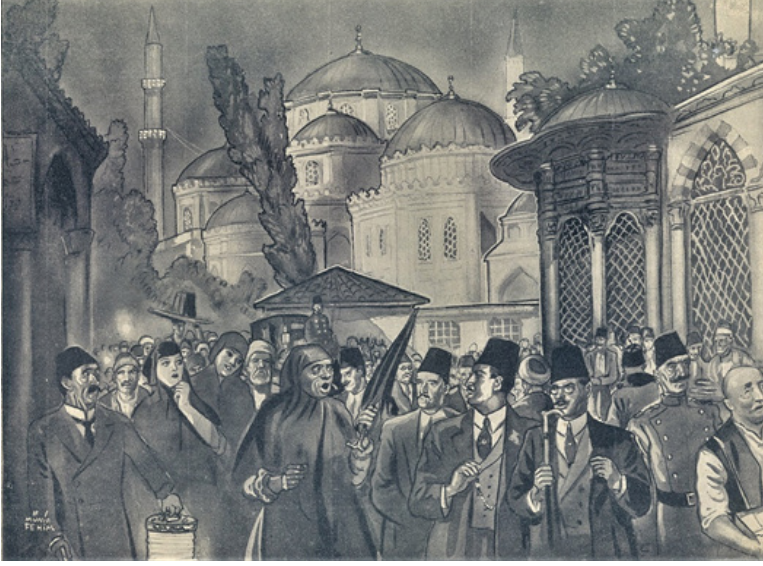
Şekil 4: Münif Fehim’in Kaleminden Direklerarası’nda Piyasa.

“Vezneciler’den Osman Baba Dergâhı önüne kadar sebilhane bardakları gibi dizilen fesi kalıplı, yakalıgı temiz, paltosu düzgün, pantolonu ütülü, potini boyalı, bey, beyzade, efendi ve efendizadeler” 64 olarak tasvir etmektedir.