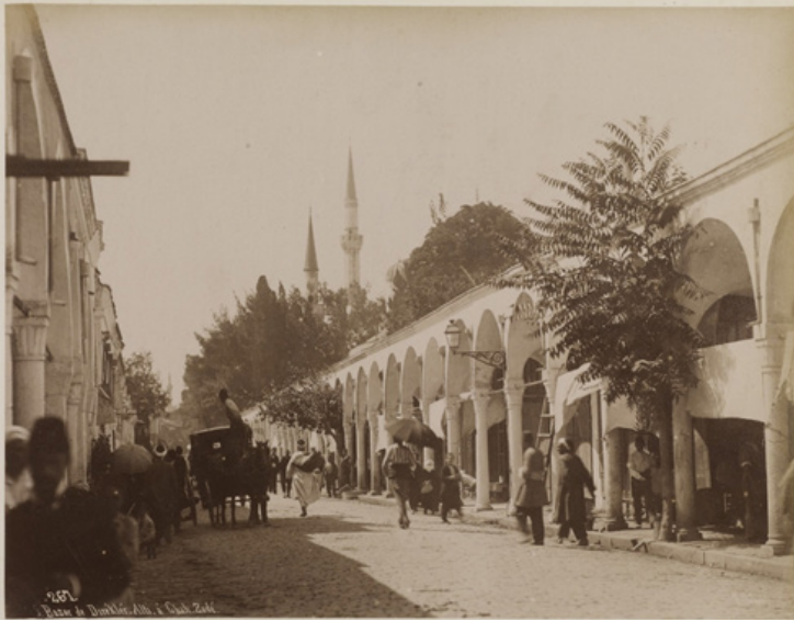
Şekil 2: Şehzadebaşı'nda Direkleraltı Çarşısı, 1880'ler.

gelmektedir 19 . Meninski'nin 1680 yılında hazırladığı sözlükte “temaşa”nın ilk anlamı “birbiri ile yürüşmek”tir 20 . Direklerarası'nda temaşa hem çeşitli gösteri unsurlarını izleme hem de piyasa caddesinde birlikte yürüme, birbirini gözleme ve toplumsal etkileşim kurma deneyimlerini kapsamaktadır. Direklerarası Caddesi'nde yürüyenler için temaşageran ya da erbab-ı temaşa kavramları kullanılmaktadır 21 . Nitekim Hüseyin Rahmi Gürpınar (1864-1944), 1918 yılında yayımlanan ve yaklaşık yirmi yıl öncesinde yaşanan bir olaya dayanan Son Arzu romanında Direklerarası piyasasını “Sokaktan geçenler iki geçeli dükkânlarda oturanları ve oturanlar geçenleri seyrediyorlar. Harici, dâhili mütakabil birer temaşa” sözleriyle tasvir etmektedir 22 .