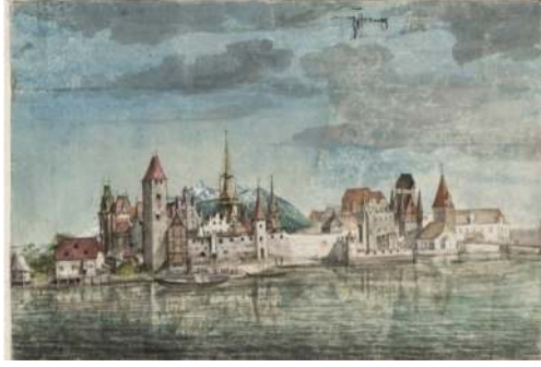
Resim 3: Innsburg'un 1495 yılına ait ve Albrecht Dürer imzasını taşıyan suluboya resmi.