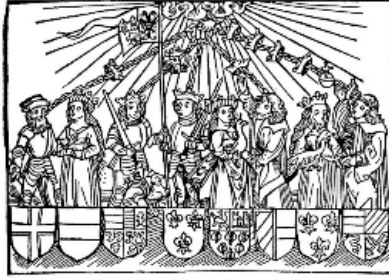
zu ewen ewiglichen kuniglicher maiestät von der vereynung der kunig und anschlag an die türcken. Schönkammer Holzt.

So ich all ding vff erbedacht Vff vnd abtut vnd wider acht Vnd ich was got ye hat bedacht Das hat all was mit wendy gemacht Das got dem ersten bass erlich hat got der herre godes erlich So vil sidi wurd vnd eras geben Das es allz in gluck thut sieden Des steten liden in hoher lobt