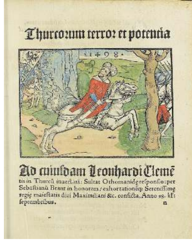
Resim 6: Sonradan renklendirilmiş ahşap oyma görselde Türk Sultan (II. Bayezid), I. Maximilian ve birliklerinden kaçarken tasvir edilmiştir.

Hristiyan kral, prens ve feodal beylere hitap etmek suretiyle Hristiyanları çarpıcı bir dille uyarmak yoluna gitmiştir. Brant'ın konuştuğu sultan, özetle, Hristiyan halklar nadiren barış içinde yaşadığından, Avrupalı hükümdarların kendi aralarında daima ihtilafta bulduklarını, böylece düşmanlarının önünü açtıklarını tespit etmektedir. Yine sultan bu nedenle Hristiyanların artık inançsızlıklarından ve eylemsizliklerinden ötürü cezalandırılması gerektiğini söyler.