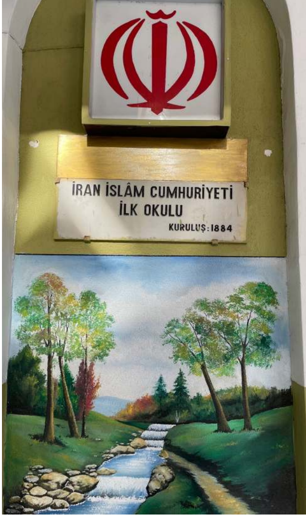
Ek 1: İstanbul Sultanahmet'te Bulunan Debistan-ı İraniyan-ı İstanbul'un Bugünkü Girişi ve Mermer İsimliđi