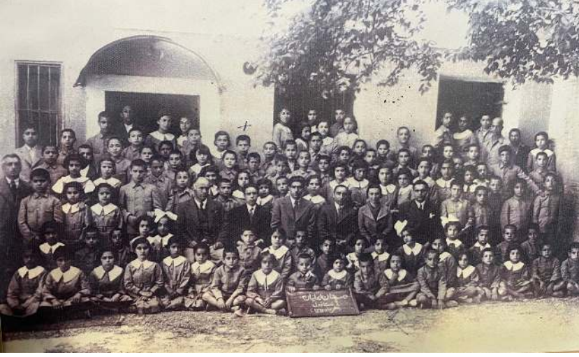
Ek 2: Debistan-ı İraniyan-ı İstanbul'un 1937-1938 Eğitim-Öğretim Yılındaki Öğrenci ve Öğretmenleri