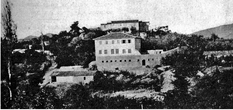
Ek 3: Yukarı ve Aşağı Evler şeklinde anılan misyon binaları. Tepedeki erkek okulu, daha aşağıdaki bina, Cunningham'ın evi ve kız yatılı okulu işlevine sahipti. Olive Trees, August/1901, s. 239.