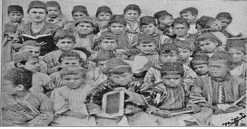
Ek 5: Nusayri (Fellah) ve Hristiyan kökenli erkek okulu öğrencileri. Olive Trees , August/1901, s. 237.