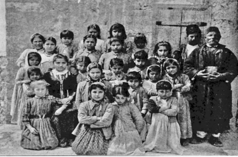
Ek 6: Kız okulunun öğrencileri. Olive Trees , September/1902, s. 262.