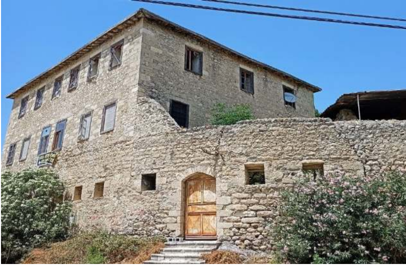
Ek 4: Bugün, 'İngiliz Protestan Okulu' şeklinde anılan ve aslında, yukarıda da görüldüğü üzere, kız okulu olduğu anlaşılan binanın şimdiki hâli. Resim bize aittir. Binanın benzer resimleri için ayrıca bk. Çelik, age. , s. 258-261; Zubari, age. , s. 63.