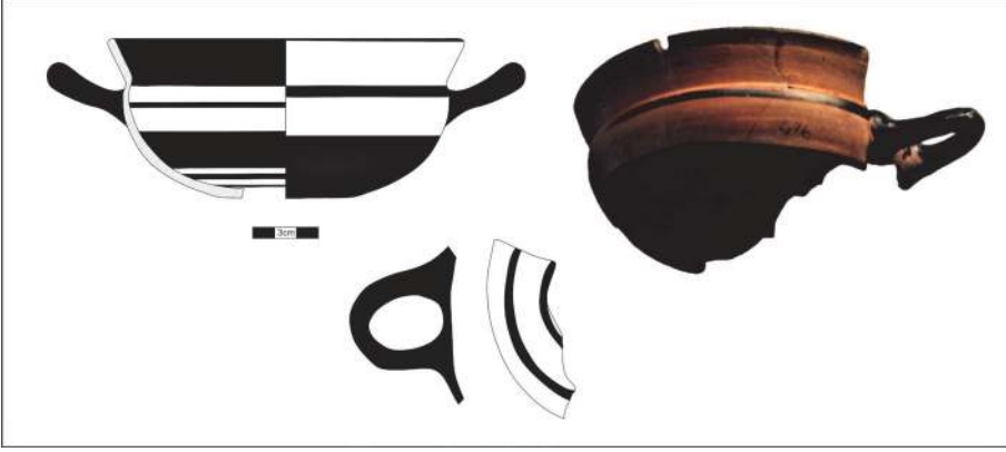
Figür 9: Arkaik Dönem konutlarında bulunan bir İonia kylixi.