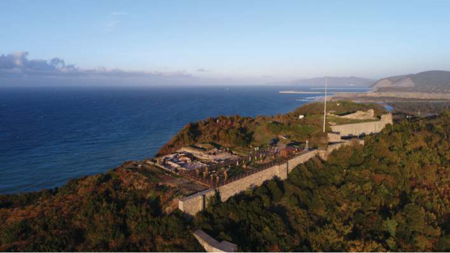
Figür 2: Tieion Akropolisi ve Billaios Nehri'nin batıdan görünümü.