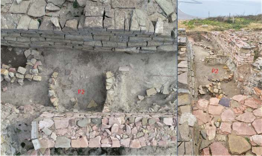
Figür 4: Yuvarlak planlı konutlardan P2 yapısı.