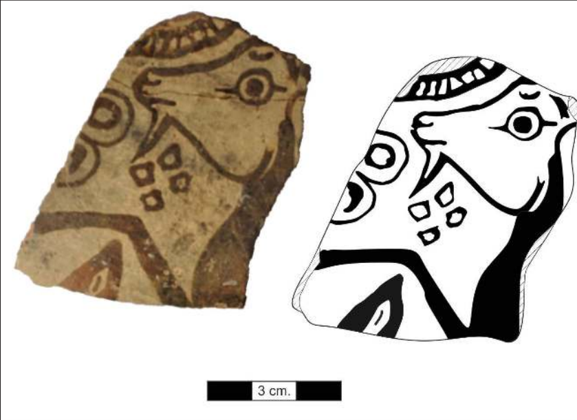
Figür 8: Miletos Orta Yaban Keçisi 2 evresi'ne tarihlendirilen seramik parçası.