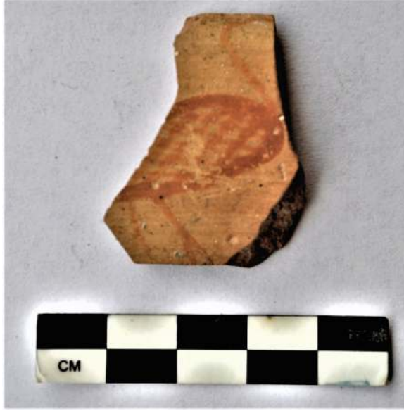
Figür 11: Akropolde bulunan Arkaik Dönem kuşlu kase parçası.