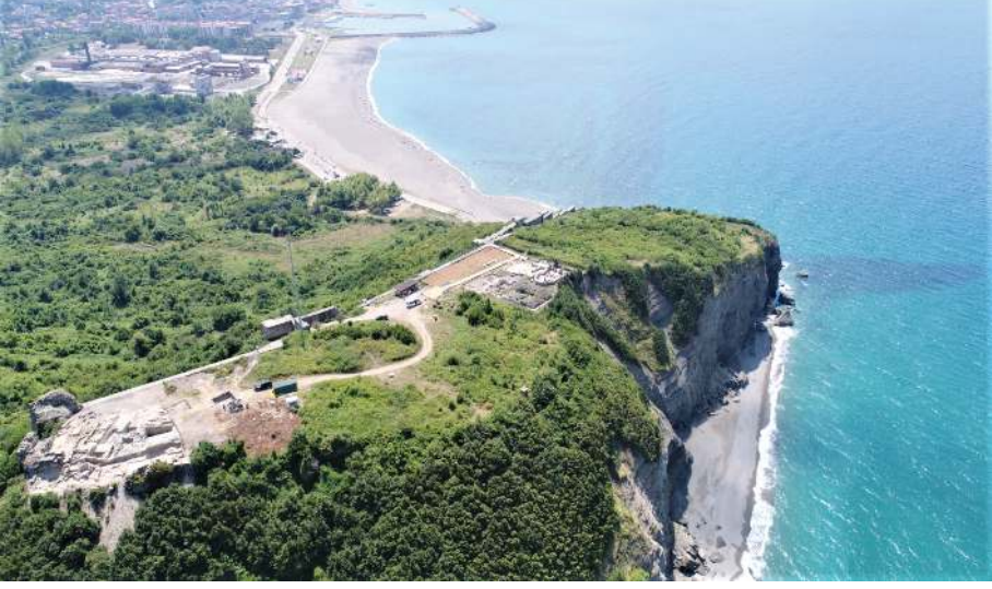
Figür 1: Tieion Akropolisinin doğudan görünümü.