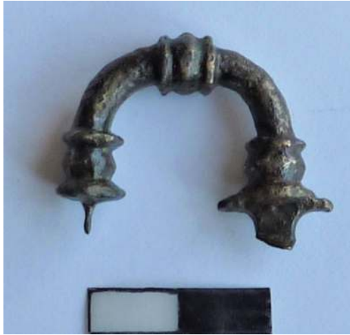
Figür 15: Gökçebey, Üçburgu'da nehir limanı kazıları sırasında bulunan bronz Phryg fibulası.