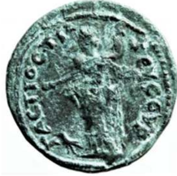
Figür 19: MS 3. yüzyıla tarihlendirilen, arka yüzünde Zeus Syrgastios betimlemesi bulunan Tieion darbı bronz sikke.