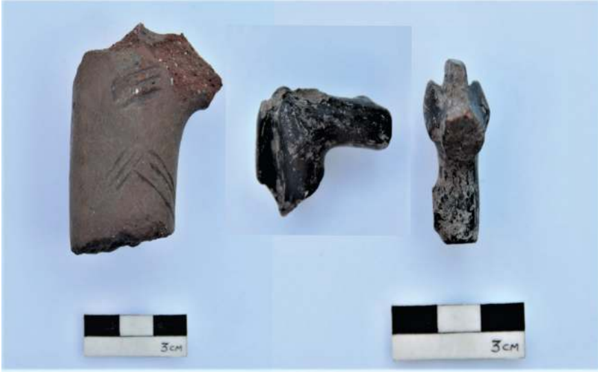
Figür 14: P1 yapısında bulunan pişmiş toprak at figürünü parçaları.