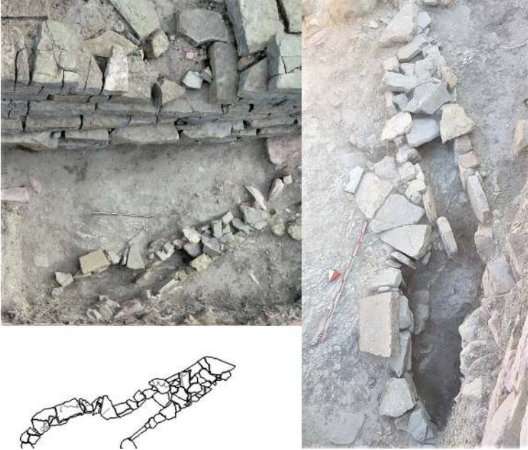
Figür 6: Arkaik Dönem'e tarihlendirilen demir ocağı.