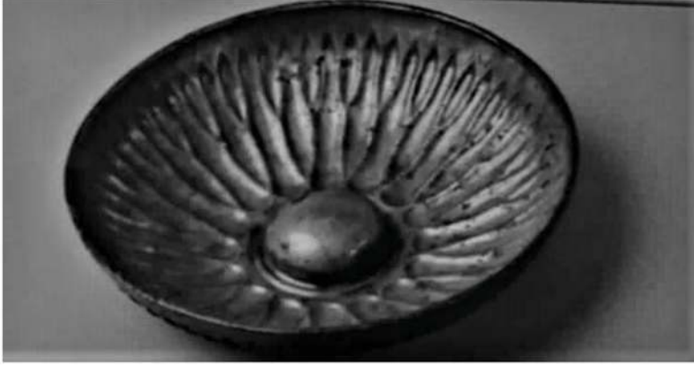
Figür 16: Gökçebey'de bir tümülüsde bulunmuş omphaloslu bronz kase.