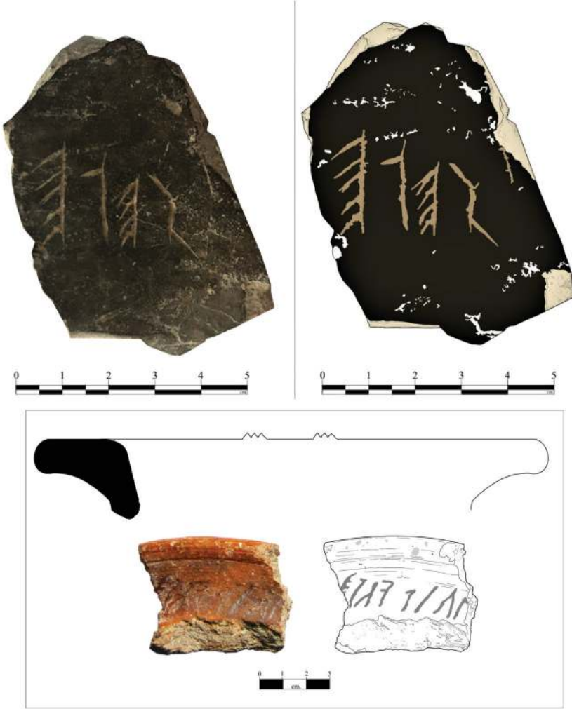
Figür 13: Üzerinde Phrygce yazıtlar bulunan pişmiş toprak kap örnekleri.