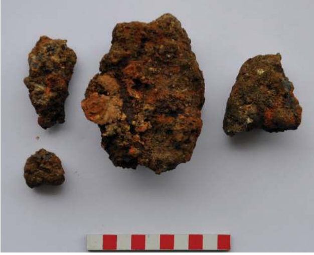
Figür 7: Arkaik Dönem ocağında bulunan demir curufları.