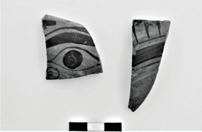
Figür 10: P1 yapısının 2. evresinde bulunan gözlü kylix örneği.