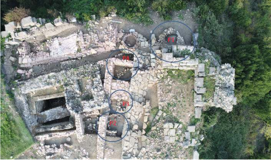
Figür 3: Akropolde bulunan Arkaik Dönem konutlarının konumları.