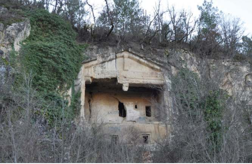
Figür 17: Karakoyunlu Köyü Gerdekboğazı kaya mezarı.