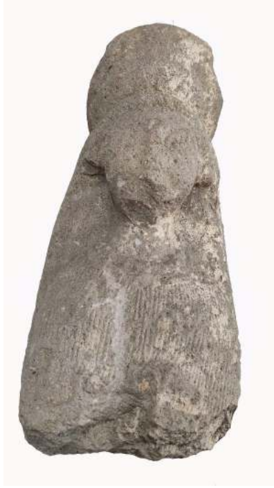
Figür 18: Alaplı'da bulunan Kybele heykeli.