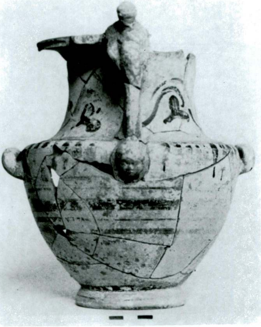
Res. 1 - Metropolis hydriasi.