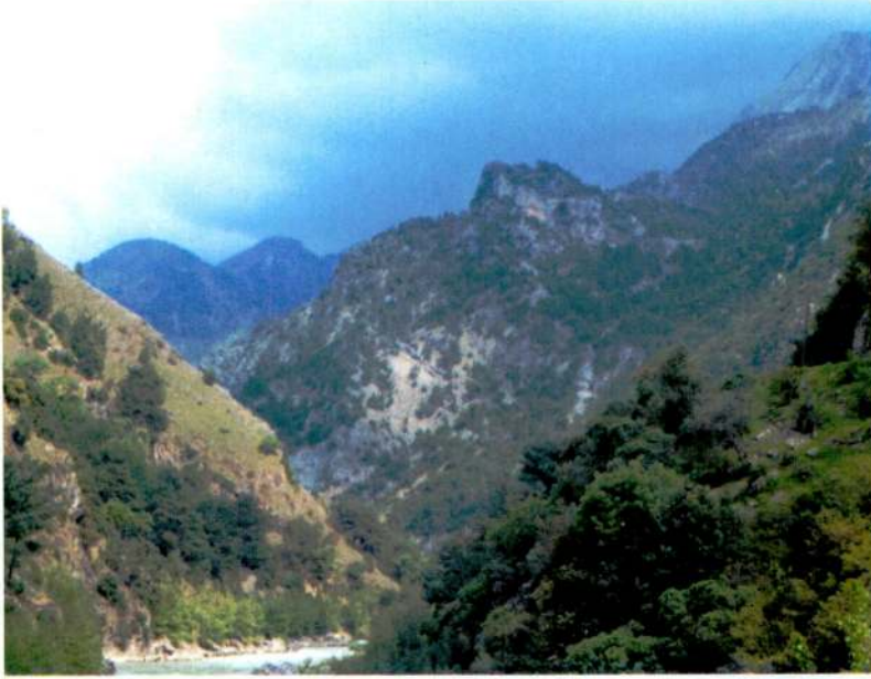
Res. 78 - Haruniye kaplıcasının kuzey doğusundaki dağ formasyonu.