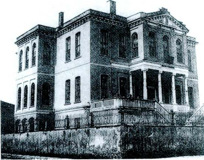
Ömer Âli Bey'in Tekirdağ'da yaptırdığı Hükümet binası sonradan genişletilmiştir.