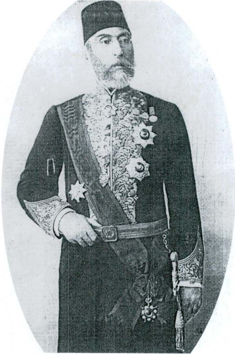
Ömer Âli Bey 1898'de ( Malumât , VII/164/883)