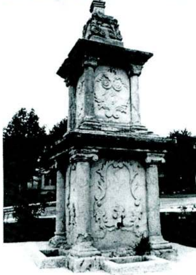
Ömer Âli Bey'in Kastamonu'da yaptırdığı abide/çeşme (Yâdigâr Çeşmesi)