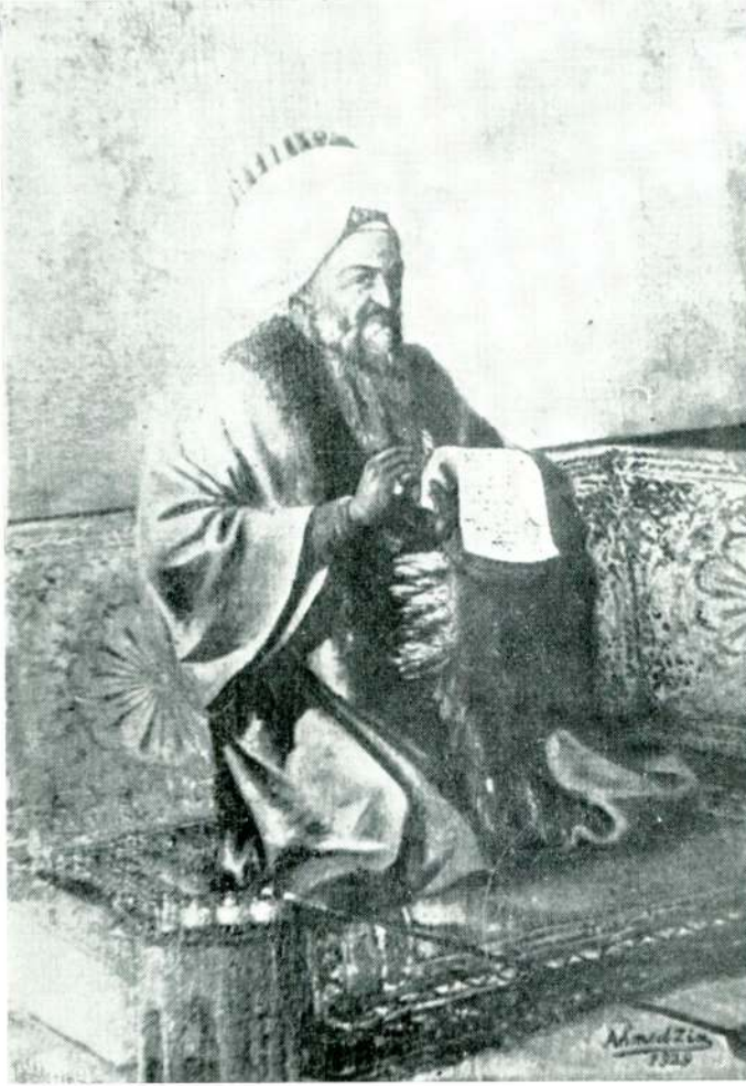
Başhoca İshak Efendi

(Astronomi Profesörü ve Kandilli Rasathanesi eski Müdürü Fatih Gökmen (1877 - 1955) tarafından Rasathane için ressam Nazmi Ziya Güran'a (1881 - 1937) yaptırılmıştır).