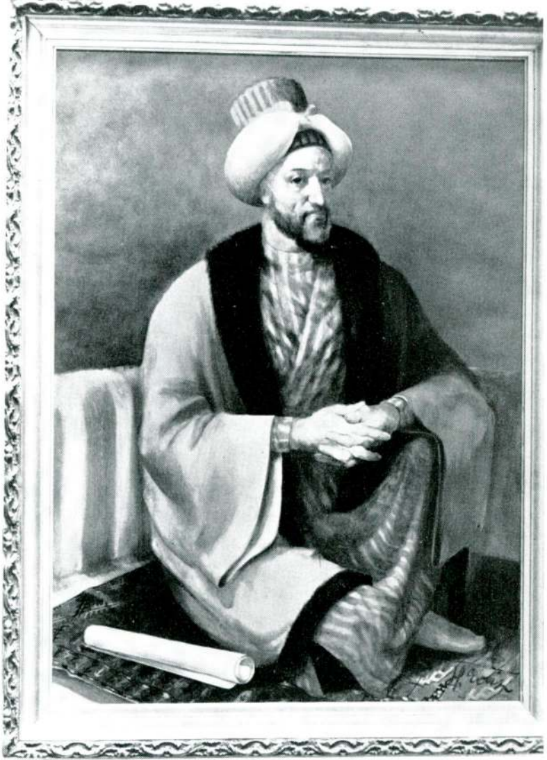
Başhoca İshak Efendi

(Güzel Sanatlar Akademisi öğretmenlerinden Ressam Edip Hakkı Köseoğlu tarafından yapılmış ve 31 Ekim 1943 de açılmış olan Beşinci Devlet Resim ve Heykel sergisinde teşhir edilerek birincilik mükâfatı almış bulunan bu tablonun orijinali, İstanbul'da Resim ve Heykel Müzesinde, bir kopyesi de İstanbul Teknik Üniversitesi Mimarlık Fakültesindedir).