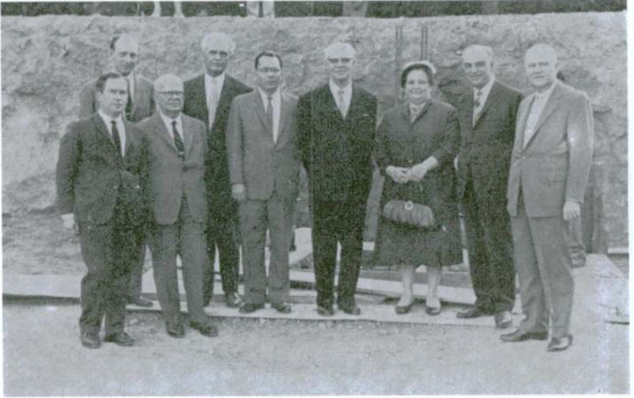
Res. 6 — Türk Tarih Kurumu üyelerinden bir kısmı yapı yerinde.