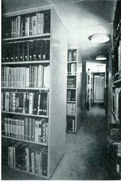
Kitap deposundan bir bölüm