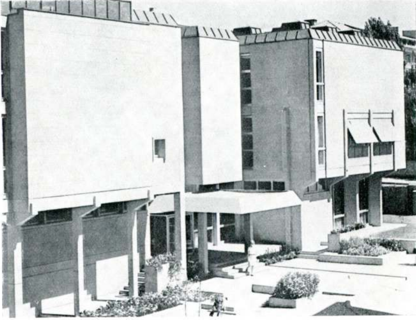
Türk Tarih Kurum binasının cepheden görünüşü