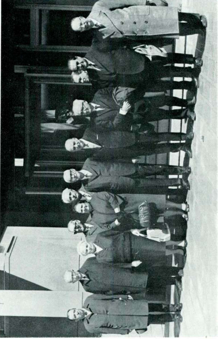
Türk Tarih Kurumu üyelerinden bir kısmı Kurum binası önünde