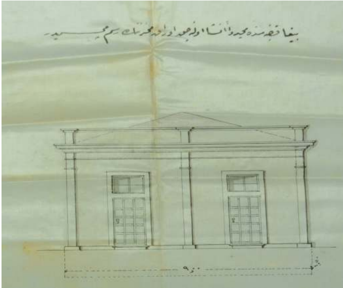
Resim 3. Biga'da İnşa Edilecek Evrâk Mahzeninin Resmi 61