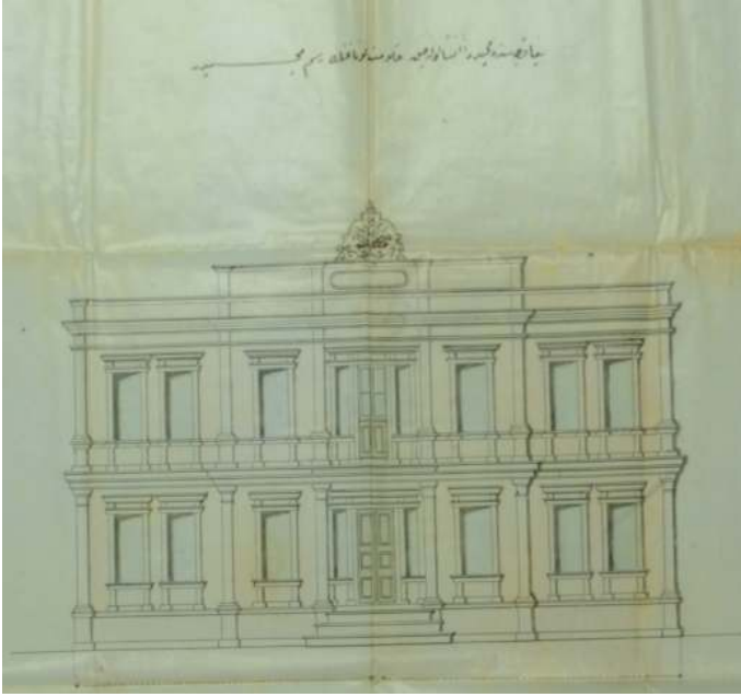
Resim 1. Biga'da Yapılacak Hükümet Konağı Resmi 59

Böylece, aşağıda resimleri görülen binalardan yalnızca hükümet konağı yapılmış, diğer binalar ise tamamlanamamıştır. Ancak hükümet konağının inşasına da hemen başlanamayacaktır. Çünkü Biga'yı yeni bir yangın felaketi beklemektedir.