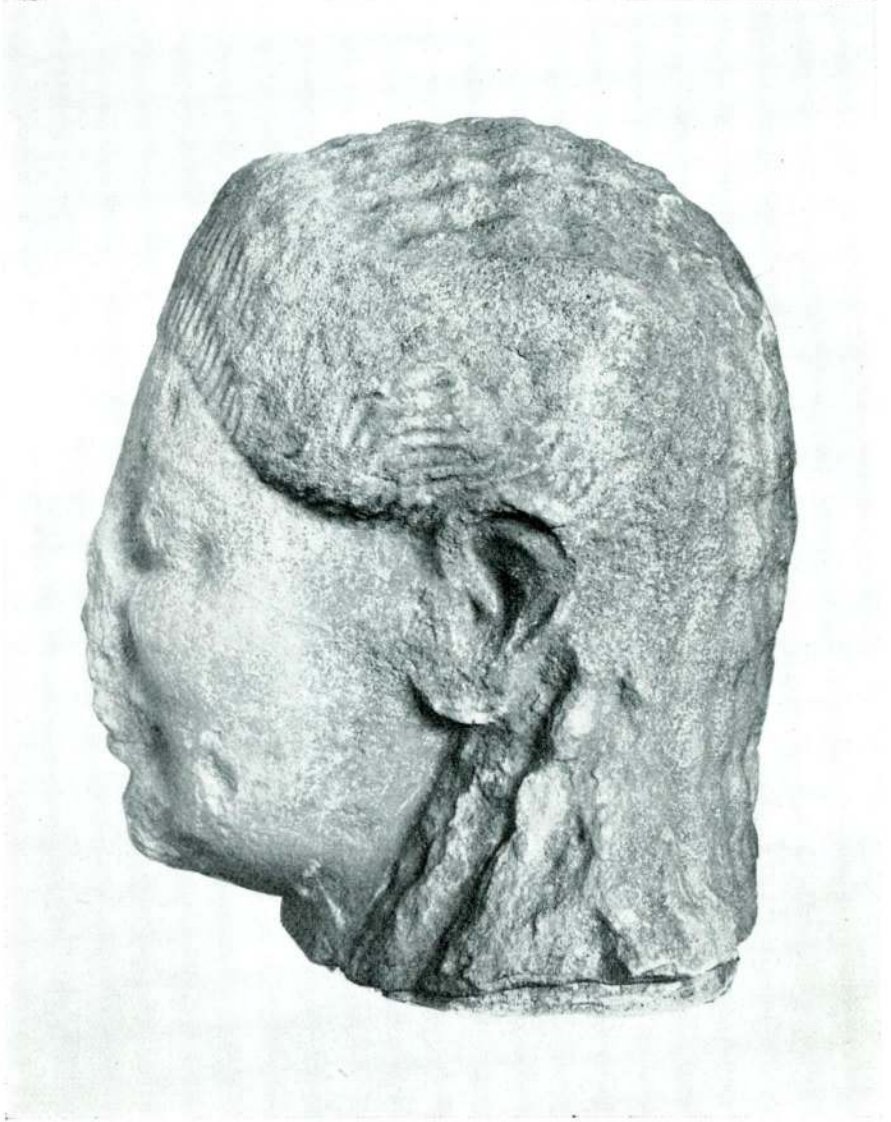
Res. 7 — Keramos'ta bulunan bařın profilden gorunüşü.