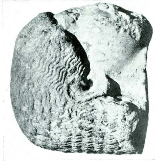
Res. 3 — İzmit Kuros'unun sağdan görünüşü.