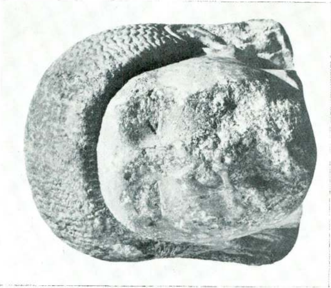
Res. 1 — İzmit Kuros'unun cepheden görünüşü.