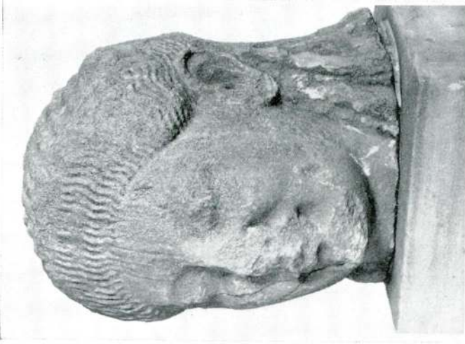
Res. 6 — Keramos'ta bulunan bař.