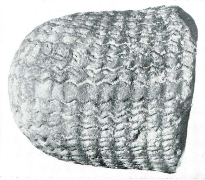
Res. 5 — Izmit Kuros'unun arkadan grnř.