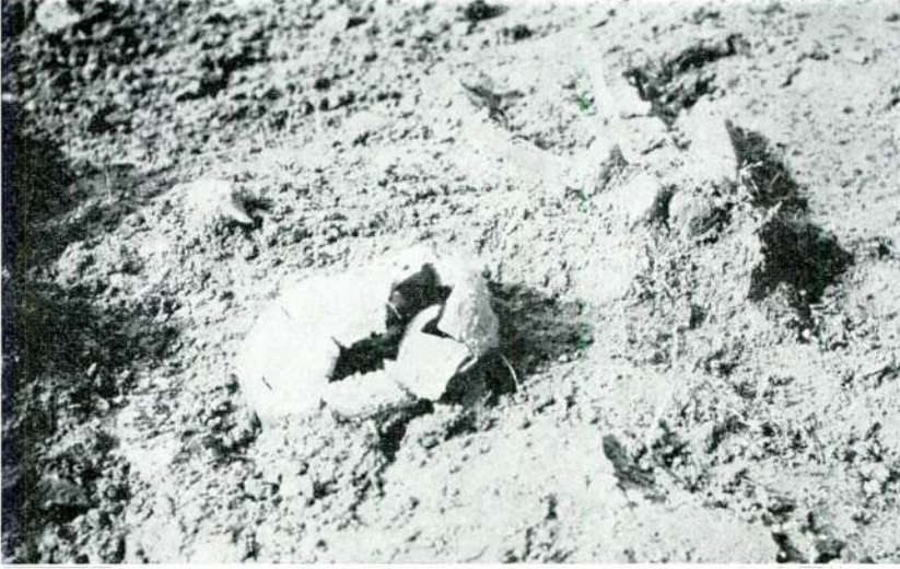
Res. 1 — Al. P. No. 1 iskeletinin bulunuş vaziyeti *