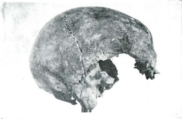
Res. 3 — Alaca - Höyük Al. P. No. 1