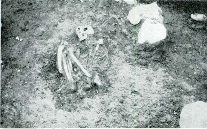
Res. 2 — Al. P. No. 2 iskeletinin bulunuş vaziyeti *