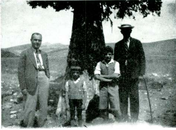
Res. 7 — Ankara civarında bir Ardıç Nezir ağacı.