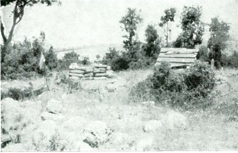
Res. 1 — Geyre (Afrodisias) civarında (Aydın) bir tahtacı mezarlığı.