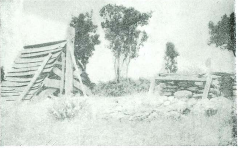
Res. 3 — Geyre tahtacı mezarlığı (Detay).