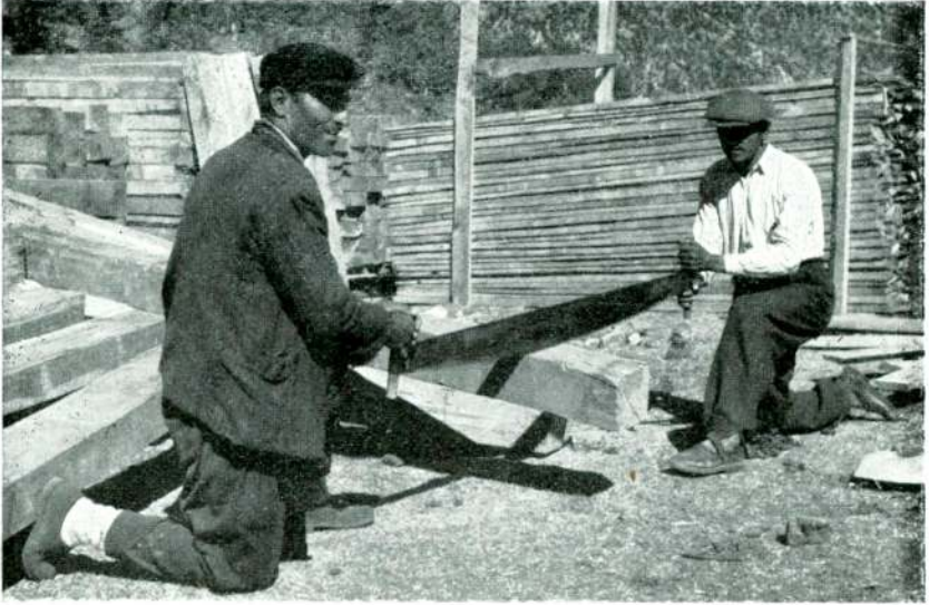
Res. 4 — Eynif'te (Antalya) tahtacılar.