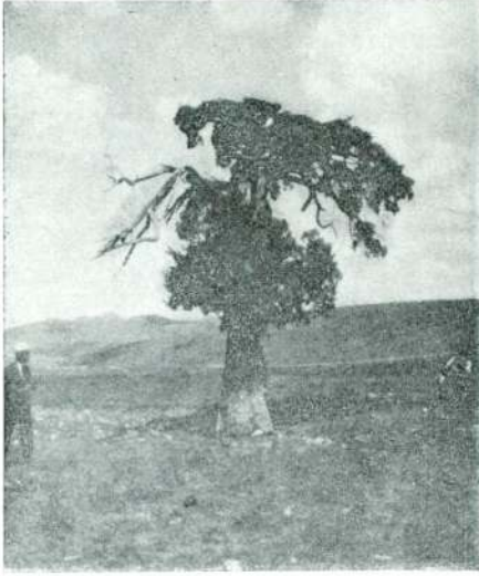
Res. 8 — Ardıç Nezir ağacı.