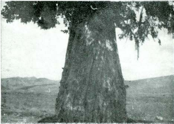
Res. 9 — Aynı ağacın gövdesine çakılmış taş, demir parçaları, asılmış çaputlar.