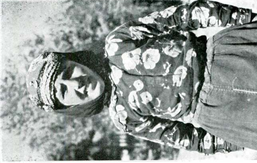
Res. 6 — Eynif'te bir tahtacı Bayan.