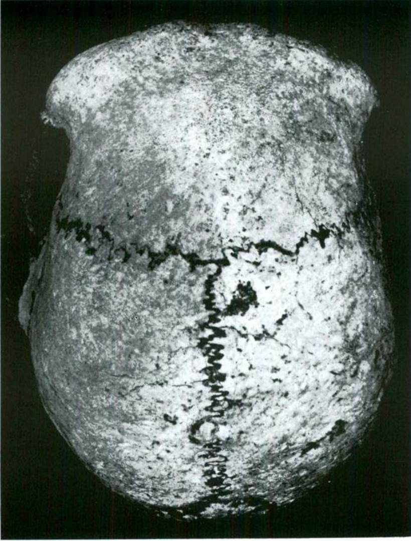
Resim I — Petralona Kafatasının üstten görünüşü.