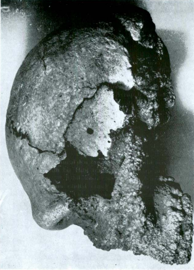
Resim II — Petralona Kafatasının sol taraftan görünüşü. Temizlenmiş olan kısımları göstermektedir.