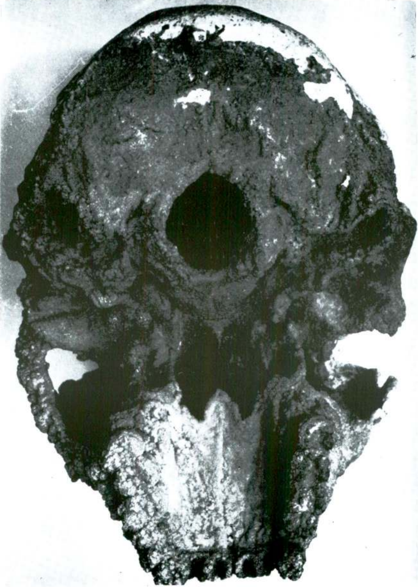
Resim III — Petralona Kafatasının alt taraftan görünüşü, temizlenmeden evvel.