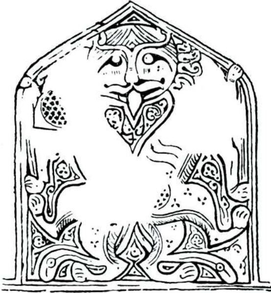
Res. 3 = Abb. 3 — Ars Islamica, V. P II. fig. 14