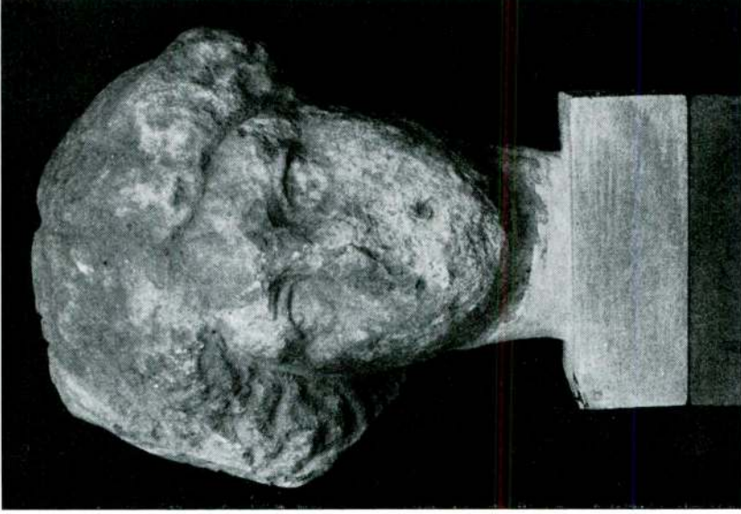
Res. 1 — Kadın başı (Julius - Clavdius'lar devri).