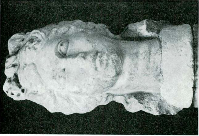
Res. 3 — Genç kadın başı (Flavius'lar devri).