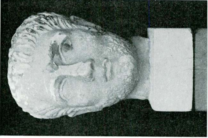
Res. 4 — Genç sakallı erkek başı (Hadrian devri).