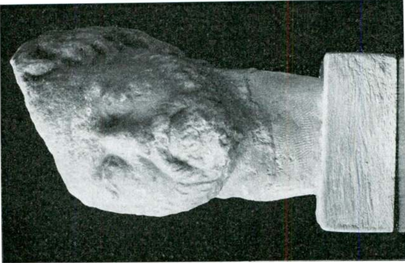
Res. 5 — Sakallı küçük erkek başı (Hadrian devri).