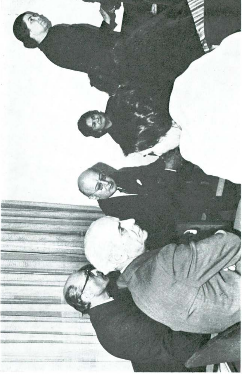
Türk Tarih Kurumu'nun 40. yıldönümü töreni dolayısıyla verilen kokteylde Başbakan Prof. Dr. Nihat Erim, Adalet Bakanı İsmail Arar ve Milli Eğitim Bakanı Şinasi Örel Kurum Üyeleriyle.