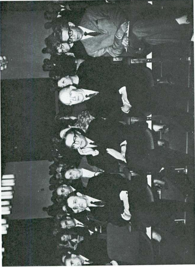
Türk Tarih Kurumu'nun 40. yıldönümü törenini izleyen davetliler.