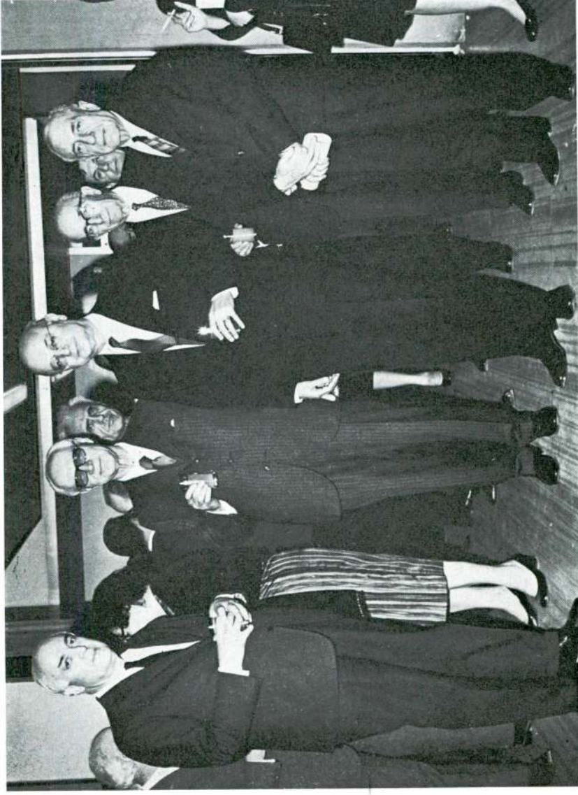
40. yıldönümü Kokteylinde Sayın Başbakan Prof. Dr. Nihat Erim Kurum Başkanı ve Konuklarla bir arada.