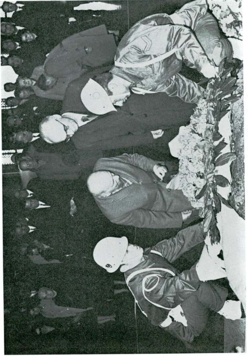
Türk Tarih Kurumu Üyeleri Anıtkabre Çelenk koyarken.