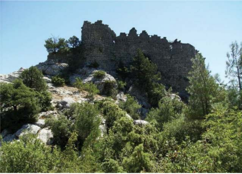
Resim 2: (Uğurlubağ Kalesi)