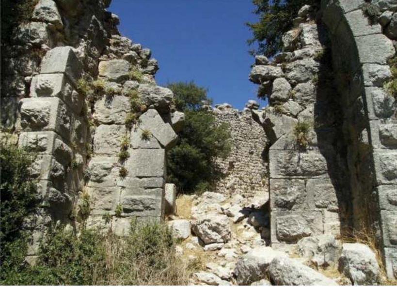
Resim 1: (Uğurlubağ Kalesi)