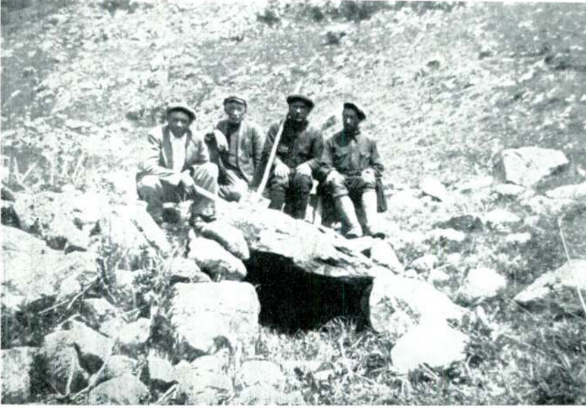
Res. 1 — Çaycı köyü (Arpaçay) galerili dolmenin galeri ağızı.