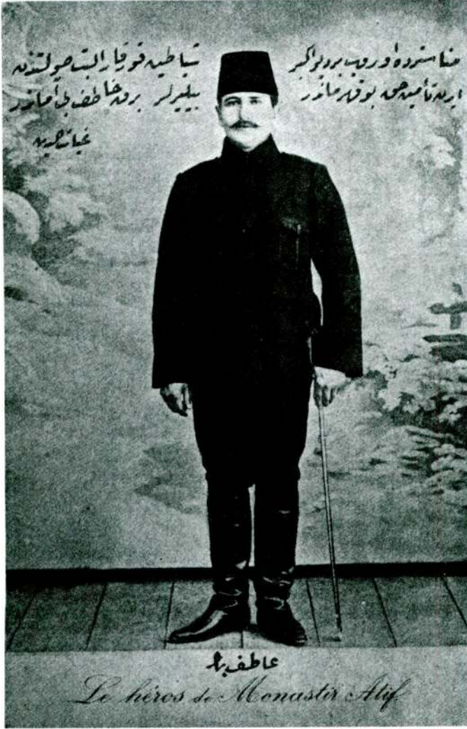
Atıf Bey'in zamanında basılan bir resmi