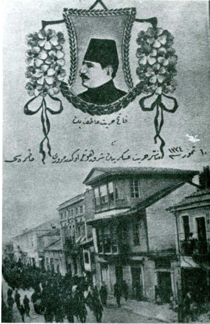
II. Meşrutiyet Hatırası