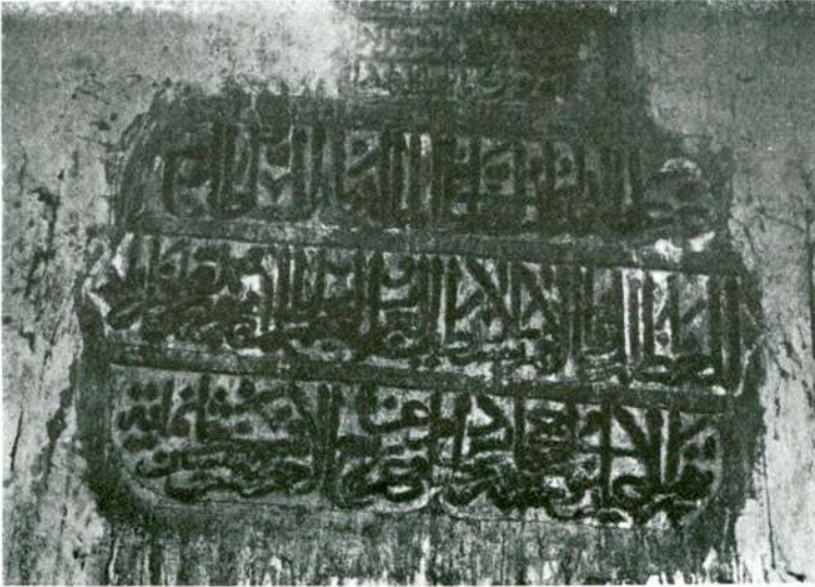
Res. 2 — Dar ül-huffaz kitabesi