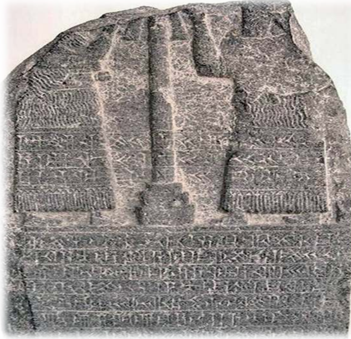
Fig. 3. Antakya Steli (Veysel Donbaz, 1999).