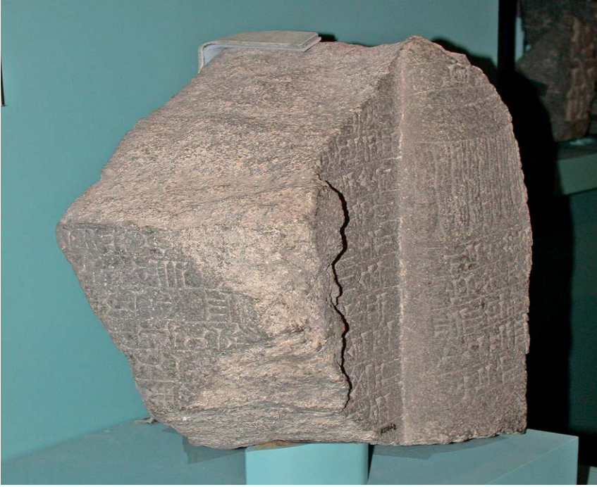
Fig. 4. Tell Tayinat(Kunulua) Kazılarında Bulunmuş II. Sargon'a ait Stel (Jacob Luinger-Batiuk Stephan, 2015).