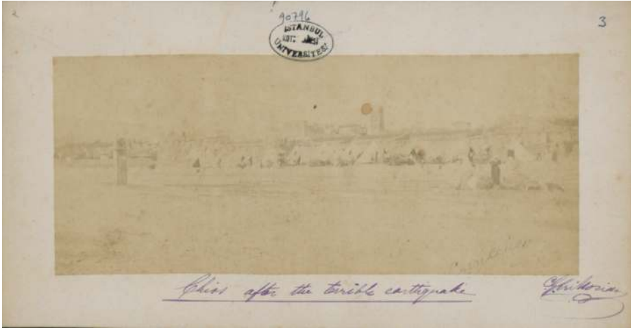
Resim 4: 1881 Sakız depremi sonrasında kurulan çadırkent. 13