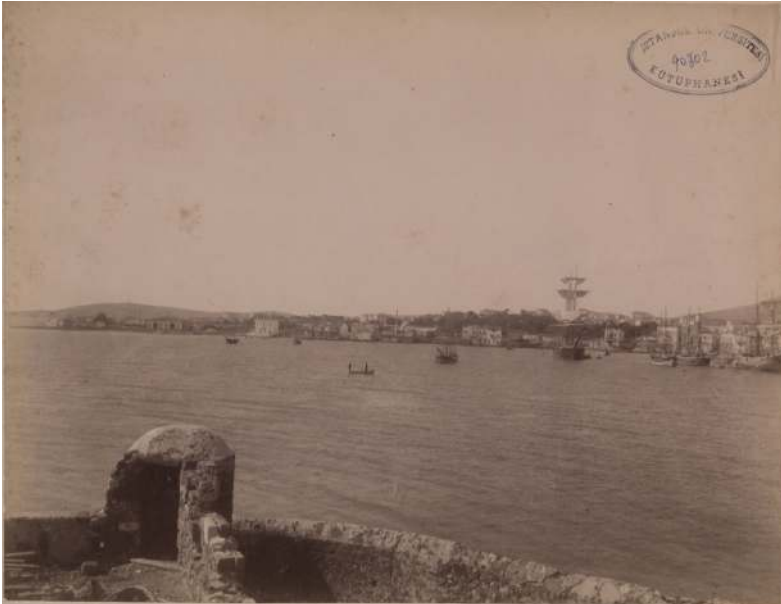
Resim 1: Sakız Adası'nın denizden görünümü. 6

Batı Anadolu kıyısındaki Çeşme kazasının tam karşısında ve 13 km açığında, 841 km 2 lik bir alana sahip olan Sakız Adası, coğrafi konumu gereği eski dönemlerden beri ticari ve askeri bir öneme sahipti. 1566-1913 yılları arasında Osmanlı hâkimiyetinde kalan ada, fetihten sonra Kapudan Paşa eyaletine sancak olarak bağlanmıştı. 1880-1887 tarihleri arasında yani yıkıcı depremin yaşandığı dönemde Sakız sancağı, Cezâyîr-i Bahr-i Sefid vilayetinin merkezi konumundaydı. Cezâyîr-i Bahr-i Sefid vilayeti, İstanköy, İpsara, Karyot, Leryoz, Kalimnoz kazalarından oluşan Sakız sancağının yanı sıra Rodos, Midilli, Sisam ve Kıbrıs sancaklarını kapsamaktaydı 4 . Vali Sadık Paşa'nın verdiği bilgilere göre depremin yaşandığı sırada adada Sakız kentinin yanı sıra 59 köy bulunmaktaydı. Bu köyler, mastaki (sakız), dağ ve ova köyleri olmak üzere üç gruba ayrılmıştı 5 .