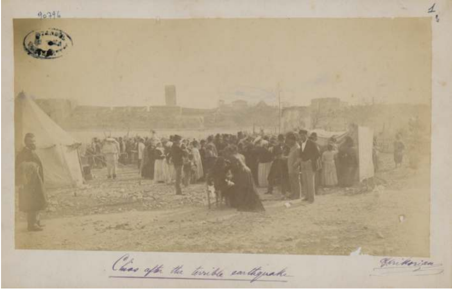
Resim 3: 1881 Sakız depreminde açıkta kalan afetzedeler. 12