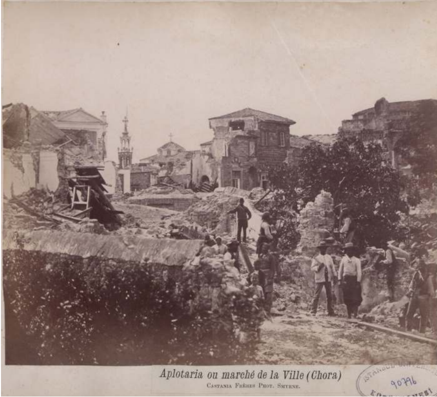
Resim 2: 1881 Depremi sonrasında Chora Köyü. 10