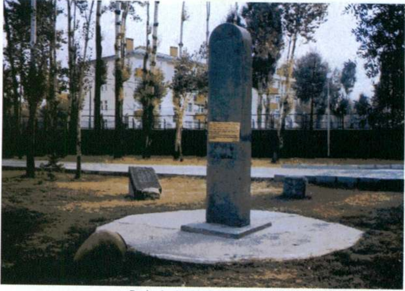
Resim 3 - Stelin önden görünüşü.