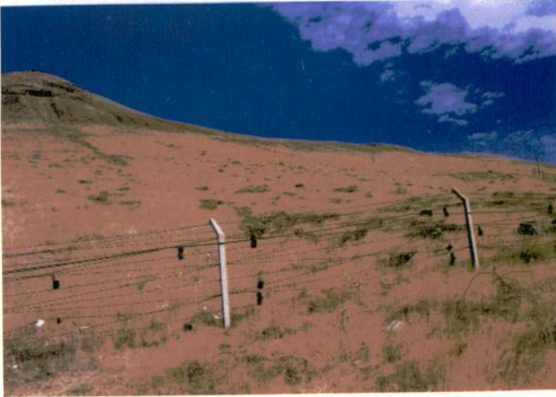
Resim 2 - Kot Tepe 2001, telefon direklerinin güneybatıdan görünüşü.