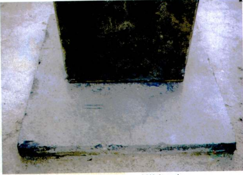
Resim 5 - Kaidenin ön kısmındaki kabartmalar.