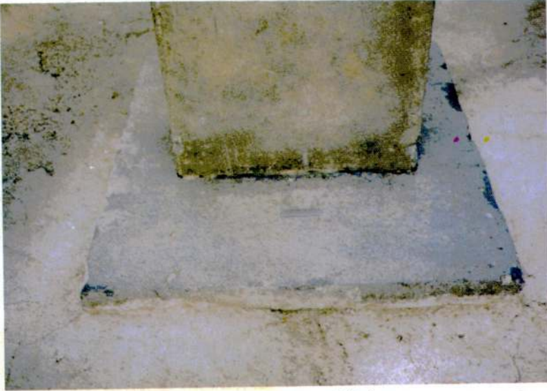
Resim 6 - Kaidenin arka kısmındaki kabartma.