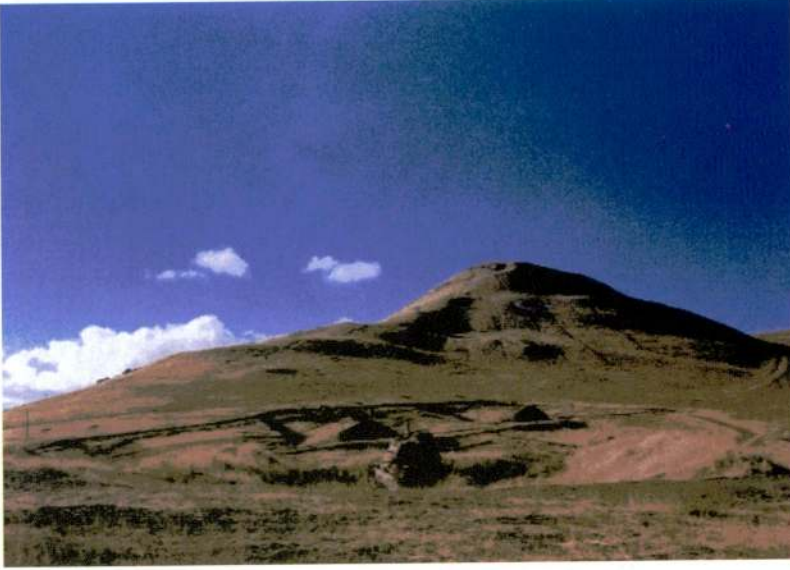
Resim 1 - Kot Tepe 2001, doğudan görünüşü.