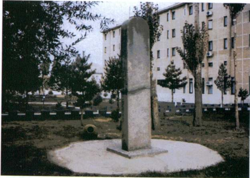
Resim 4 - Stelin arkadan görünüşü.