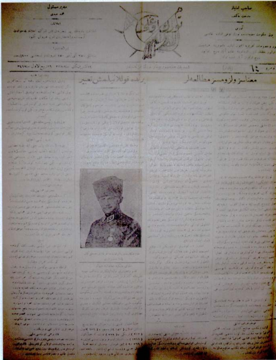
-Türkoğlu'nda "Halaskâr-ı Millet Başkumandanımız" sıfatıyla fotoğrafı yayımlanan Gazi Mustafa Kemal Paşa (Türkoğlu, 19 Kasım 1922).