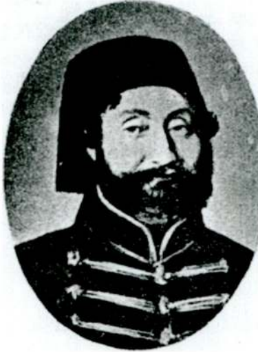
Resim 2 - Damat Ahmed Fethi Paşa (Halûk Y. Şehsuvarođlu, "Atiye Sultan", Resimli Tarih Mecmuası , c. 3/sy. 25 (Ocak 1952, s. 1201))