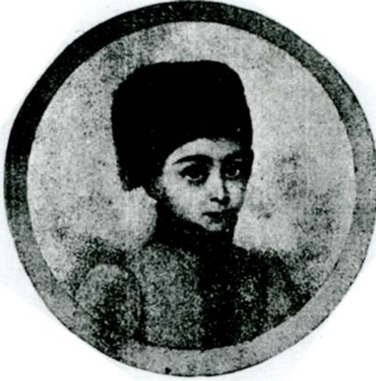
Resim 1 - Atiye Sultan'ın erkek kıyafetiyle çocukluğu (Halûk Y. Şehsuvarođlu, "Atiye Sultan", Resimli Tarih Mecmuası , c. 3/sy. 25 (Ocak 1952, s. 1200))