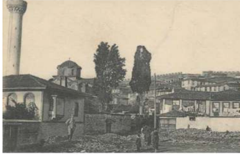
Selanik Yakup Paşa Camisi