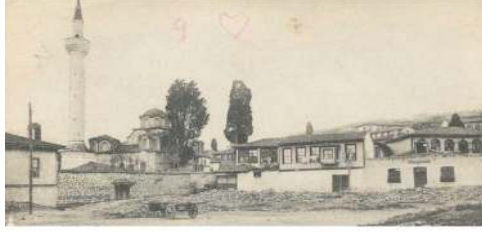
Selanik Yakup Paşa Camisi