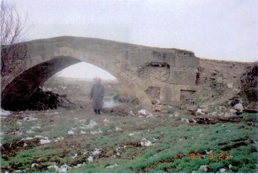
Res. 4 – Uşak, Çanlı-köprü, 1997 Martu'nda, Kaynak tarafından görünüş.