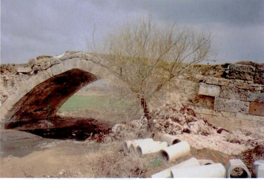
Res. 3 – Uşak, Çanlı-köprü, 1997 Martu'nda, Mansab tarafından görünüş: Kitabe yeri boş.