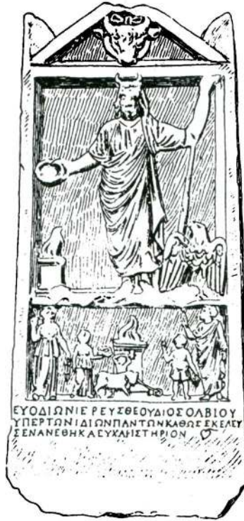
Res. 2 - Zeus Olbios'a ithaf edilmiş olan Adak Steli.