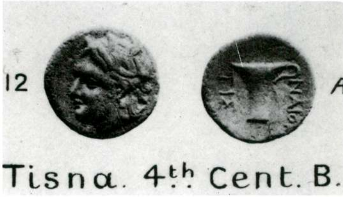
Res. 1 - M.Ö. IV. yüzyılda darbettirilmiş olan Tisna Sikkesi.