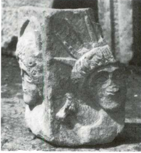
Res. 5 - İznik Müzesi (Yakup Çelebi Zaviyesi)'nde bulunan mermer kabın köşe parçası.