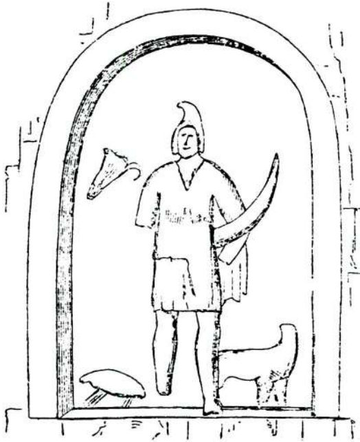
(Figure of Lunus on rocks at Hamamlı.)