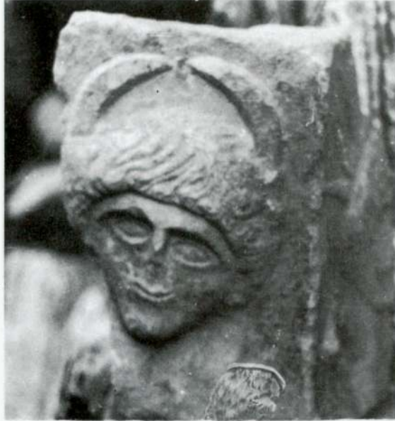
Res. 4 - İznik Müzesi (Yakup Çelebi Zaviyesi)'nde bulunan mermer kabın köşe parçası.