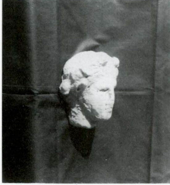
Res. 3 - Tire Müzesi'ndeki 39 Env. No'lu mermer erkek başı.