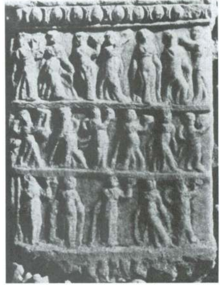
Artemis kült kabartmanın etek bölümü.