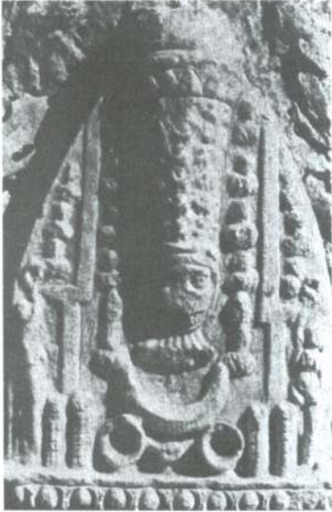
Artemis kült tasvirli kabartmanın üst bölümü.